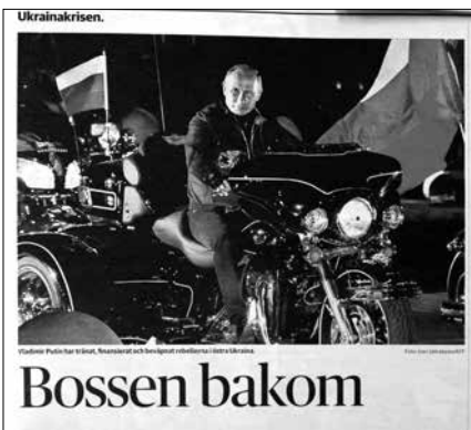
Kuva 4. Dagens Nyheter 24.7.2014.