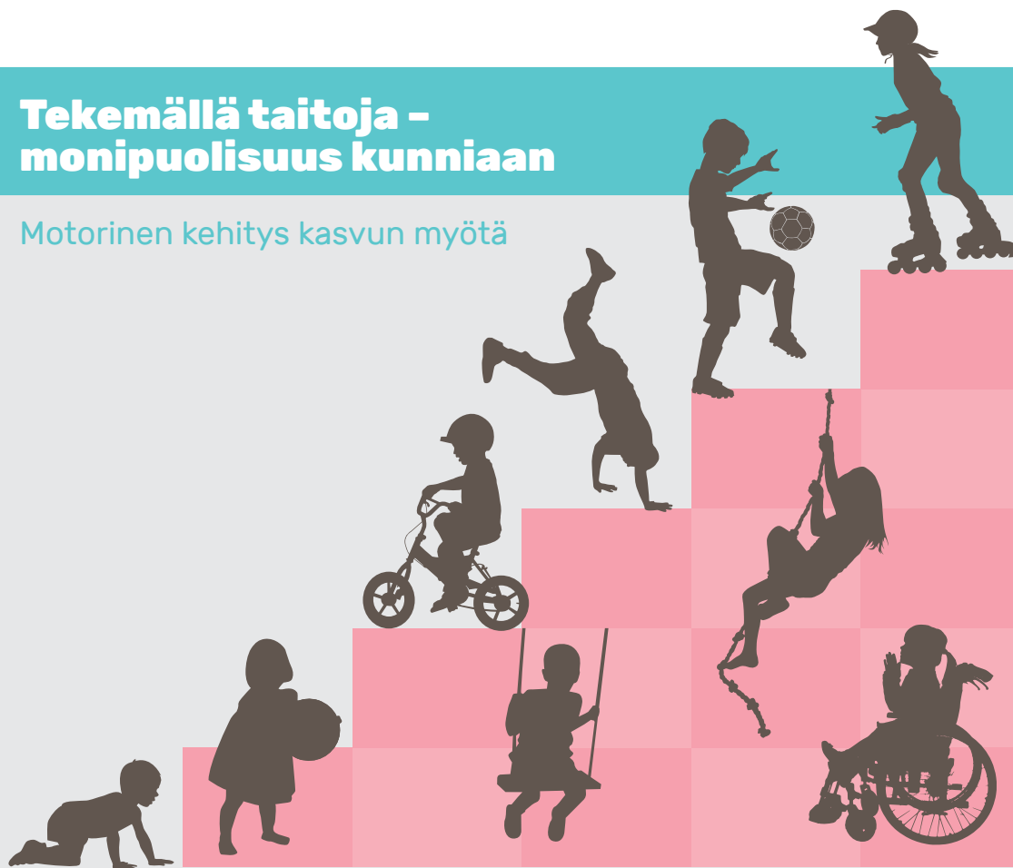
Kuvio 3. Motoriset taidot kehittyvät kasvun sekä monipuolisen leikin, liikunnan ja sinnikkään harjoittelun myötä.