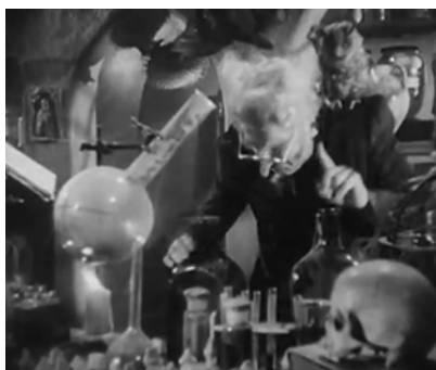
Kuva: Ohjaaja itse esittää alkemistia Willi Forstin elokuvassa Wieniläisverta.

René Clairin ura tuo mieleen Willi Forstin elokuvan Wieniläisverta ( Wiener Blut , 1942), jonka alussa ohjaaja itse esittää alkemistia. Elokuvantekijä valmistelee luomustaan, lorauttaa ensin pullosta, jonka kyljessä lukee ”Humor”. Sen jälkeen hän kaataa sekaan annoksen kevytmielisyyttä, ”Leichtsinn”, ja sydämellisyyttä, ”Herz”. Sen sijaan historiaa, ”Historie”, hän heittää mukaan vain muutaman tipan pipetillä, vaikka odotettavissa on nimenomaan menneisyyttä käsittelevä teos. Lopuksi alkemisti ottaa kouraansa pullon, joka on varustettu etiketillä ”Musik” ja kaataa mukaan kaikkein suurimman määrän. Näistä aineksista huvinäytelmä syntyy. Samaa reseptiä käytti René Clair elokuvan alkemistina, varsinkin palattuaan Hollywoodista Ranskaan toisen maailmansodan jälkeen. Ehkä tilanne