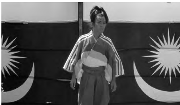
Kuva: Aloituskohtaus elokuvasta Ran.

Kurosawan toinen Shakespeare-filmatisointi Ran perustuu Kuningas Leariin . Hallitsijan ja hänen kolmen poikansa (Shakespearella he ovat tyttäriä) suhde on jälleen mestarillisesti siirretty Japanin historiaan. Näyttelijöiden ryhmitys kuvatilaan noudattaa no-teatterin symmetriaa. Etenkin Lear-hahmon, ruhtinas Ichimonji Hidetoran, ja hänen narrinsa vaelluksessa on no'maista kohtalonomaisuutta. Hidetoran kasvojen meikkaus muuttuu sitä naamiomaisemmaksi mitä pidemmälle hän vaelluksessaan ja hulluudessaan etenee. Ranin hovinarri Kyoamin esiintyminen taas noudattaa kyogen-esitystyylä – kyogen on no-esityksissä eri näyttelijöiden välissä esitettävä lyhyempi, komediallinen esitys.