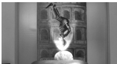
Kuva 3: Galleristin kodissa ihailaan kuvataidetta.

Elokuvallisten silmäniskujen lisäksi Suuri kauneus on täynnä viittauksia muihin taiteenlajeihin. Itse asiassa tämä ”seitsemännen taiteen” merkkipaalu rakentuu vuoropuhelussa muiden taiteiden kanssa. Osansa elokuvassa saavat niin kuva- kuin veistotaide sekä kirjallisuus ja musiikki. Erityisen näkyvässä roolissa ovat myös performanssitaide ja arkkitehtuuri. Jepin vaellus kauneuden maailmassa ikään kuin vaatii erilaisten estetiikan muotojen mukaan ottamista.