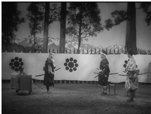
Kuva: Miehet jotka astuvat tiikerin hännälle.

henkilöt, on todellinen historiallinen kenraali. Hän joutuu pakenemaan veljeään Yoritomoa, joka epäilee häntä keinottelusta itseään vastaan. Yoshitomolla on mukanaan vasallinsa ja legendaarinen soturi Benkei, jotka kaikki ovat naamioituneet vuoristopapeiksi. Heidän on päästävä läpi Yoritomon rajatarkastuksesta.