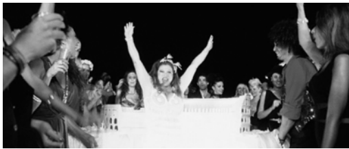
Kuva 2: Jepin 65-vuotisjuhlat on kuvattu almodóvarmaisesti.

Suurta kaunetta on oikeutetusti verrattu Federico Fellinin Ihanaan elämään ( La dolce vita , 1960), jossa Marcello Mastroiannin esittämä toimittaja etsii itseään Roomassa. Molemmissa elokuvissa kaupunki nousee itsessään yhdeksi pääosan esittäjäksi. Rinnastuskohtia voi löytää myös Fellinin elokuvaan 8 1/2 ( Otto e mezzo , 1963). Siinä Mastroianni esittää Fellinin alter egoa , elokuvaohjaaja Guido Anselmia, joka ympärillään pörräävän kulttuurieliitin paineessa yrittää löytää uudelleen inspiraation takkuilevan tieteiselokuvansa tekemiseen. Sorrentinon tapa vaihtaa Suuressa kauneudessa tunnelma yllättävillä leikkauksilla rajusta rauhalliseen ja päinvastoin, tuo puolestaan mieleen Pedro Almodóvarin. Etenkin Jepin bakkanaaliset 65-vuotisjuhlat kuvataan hyvin ”almodóvarmaisesti”.