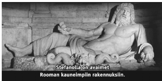
Kuva 9: Rooman palatsien taidearteita.

Performanssin onttoisuus tulee selvästi esille galleristin juhlissa, joista Jep ja hänen seuralaisensa sriptease-tanssija Ramona poistuvat pikkutyön maalausesityksen lopussa, koska se tuntuu Ramonasta lapsen hyväksikäytöltä. Jep ja Ramona lähtevät Stefano-nimisen miehen matkaan. Stefano kantaa salkussaan vanhoja avaimia, joilla pääsee Rooman salaisiin puutarhoihin ja palatseihin. Kierroksellaan kolmikko törmää mitä kauneimpiin taidearteisiin.