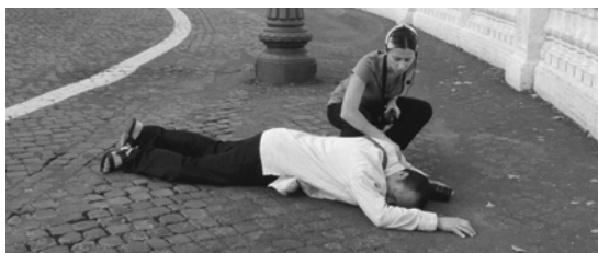
Kuvat 10–11: Ikuinen kaupunki ja kuolema.

Jepin vaellus Rooman kaduilla muistuttaa alun Céline-sitaattia ja turistikohtausta. Hän on matkalla, joka päättyy kuolemaan. Elämä on vain harhaa. Havainnon kiteyttää Jepille hänen vanha taikuriystävänsä, joka