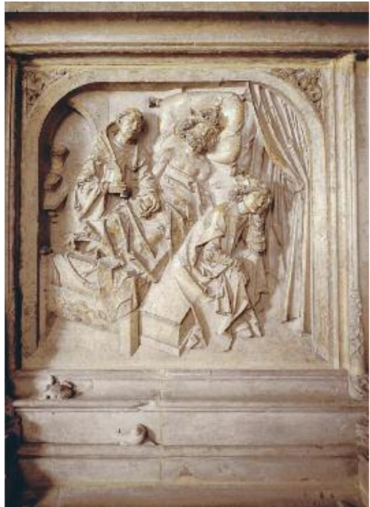
Abb. 7: Der hl. Benedikt erscheint am Krankenbett Kaiser Heinrichs II. und heilt ihn von einem Steinleiden, Relief an der Grabtumba des hl. Kaiserpaares im Bamberger Dom, Tilman Riemenschneider und Werkstatt, 1499–1513

Mit beachtlichen Argumenten wurde auch die goldene Tafel, die dem Hochaltar des Basler Doms als Antependium diente und sich heute im Musée de Cluny in Paris befindet (s. Kat.-Nr. C.VII.2, C.VII.3),