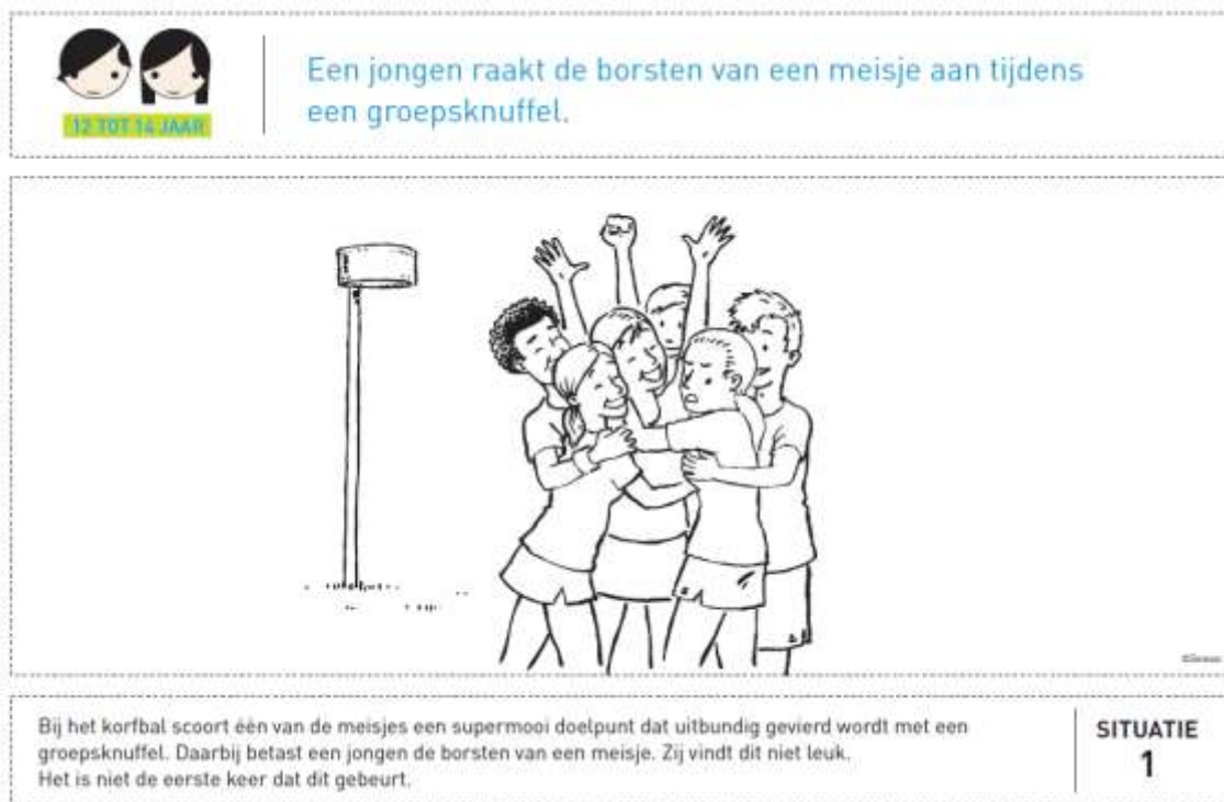
Figuur 2 Voorbeeld van een steekkaart in het Vlaggensysteem (voorkant)

Bij ernstig grensoverschrijdend gedrag zijn er enkele criteria niet vervuld en weegt één of meerdere daarvan zwaar door. Deze situaties kunnen ook gedrag dat beledigend of kwetsend is voor anderen omvatten, of gedrag dat lichamelijk, emotioneel of psychisch schade veroorzaakt. Bijvoorbeeld: bij het korfbal scoort één van de meisjes een doelpunt dat gevierd wordt met een groepsknuffel. Daarbij betast een medespeler de borsten van het meisje. Het is niet de eerste keer dat dit gebeurt (case 1 van het vlaggensysteem, zie ook Figuren 2 en 3). Rood gedrag dient verboden te worden, in plaats van begrensd (bij geel gedrag). De persoon dient geconfronteerd te worden met de situatie en dient uitgelegd te worden waarom het verboden is. Er dienen afspraken gemaakt te worden voor het geval dit gedrag zich nog eens stelt.