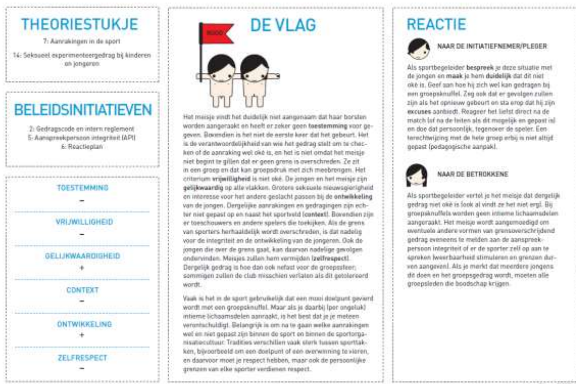
Figuur 3 Voorbeeld van een steekkaart in het Vlaggensysteem (achterkant)

Zwaar grensoverschrijdend lichamelijk of seksueel gedrag schendt meerdere criteria in ernstige mate. Gedrag dat aanstootgevend is, ernstig lichamelijke emotioneel of psychisch schadelijk, of seksueel gedrag van een volwassene ten aanzien van een kind, wordt beoordeeld met een zwarte vlag. Bijvoorbeeld: een jongen van 11 jaar jogt regelmatig met zijn coach naar huis. Plots stopt de coach in het bos en vraagt de jongen om zijn penis vast te nemen (case 10 in het vlaggensysteem).