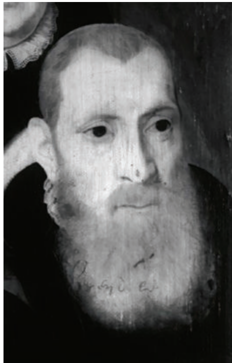
Cat. 32, afb. 1: Detail van het infraroodreflectogram.

Fierens-Gevaert 1910, 312; Weale 1919, 151; Hymans 1920, 363; Fierens-Gevaert 1922, 53; Riegl 1931, 39; Marlier 1939, 85-86; Marlier 1941; d'Hulst 1951, 217-218; Dochy 1956, 53-78; Baldass 1960, 106; Wilenski 1960, 145, 626; Van Puyvelde 1962, 265; Janssens de Bisthoven 1963, 190-196; Devliegher 1967-68, 185; Philippot 1970, 192; Friedländer 1967-76, xi, 65, 108; De Vos 1979, 28, 29, 34; Vermeersch 1981, 278; Huvenne 1983-84, 267-291, 608-609, doc. 1.34; Brugge 1984, 145-153.