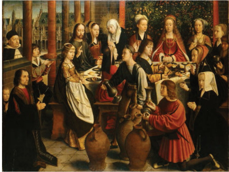
Cat. 32, afb. 2: Gerard David, Bruiloft te Kana , ca. 1500-05, olieverf op paneel, Parijs, Musée du Louvre, 1995.

Deze uitzonderlijke vondst geeft ons een kijkje in de werkplaatspraktijk van Pieter Pourbus. Gezien het belang dat eraan werd gehecht, mocht de kunstenaar geen fouten maken in de hiërarchie van de geportretteerden. Als geheugensteuntje noteerde hij de namen van alle leden volgens de voorgeschreven ordening op het paneel. Daarvan zijn er nu dus nog drie terug te vinden dankzij IRR. De opschriften verwijzen ongetwijfeld ook naar portrettekeningen die Pourbus van elk individueel lid maakte, want zijn opdrachtgevers waren tijdens het schilderen zeker niet aanwezig. Helaas zijn die portrettekeningen verloren gegaan. Deze werkwijze verklaart wellicht ook waarom Pieter Pourbus voor deze opdracht per hoofd betaald werd, zoals in het contract werd vastgelegd. 4 –AVO