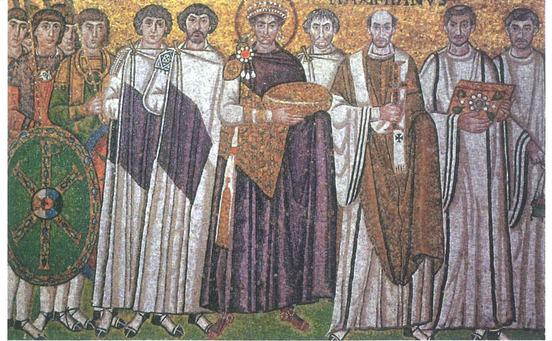
38. Mozaïek met Justinianus en gevolg, San Vitale Ravenna, 547 na Chr.

De boodschap van de speld draait in de late 4de eeuw nog altijd om het militaire beroep, maar deze wordt dan niet meer uitsluitend door soldaten gedragen. Ook hoge officieren en civiele elite dragen nu deze drieknoppenfibula op hun officiële mantel. Dit zorgt ervoor dat tegen het einde van de 4de eeuw ook de aristocratie deze populaire kledingstijl gaat gebruiken. Een voorbeeld hiervan