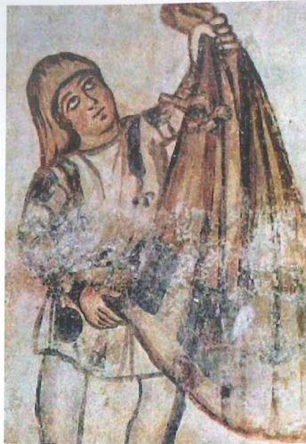
36. Dienaar met mantel, Silistra, ca 350 na Chr.