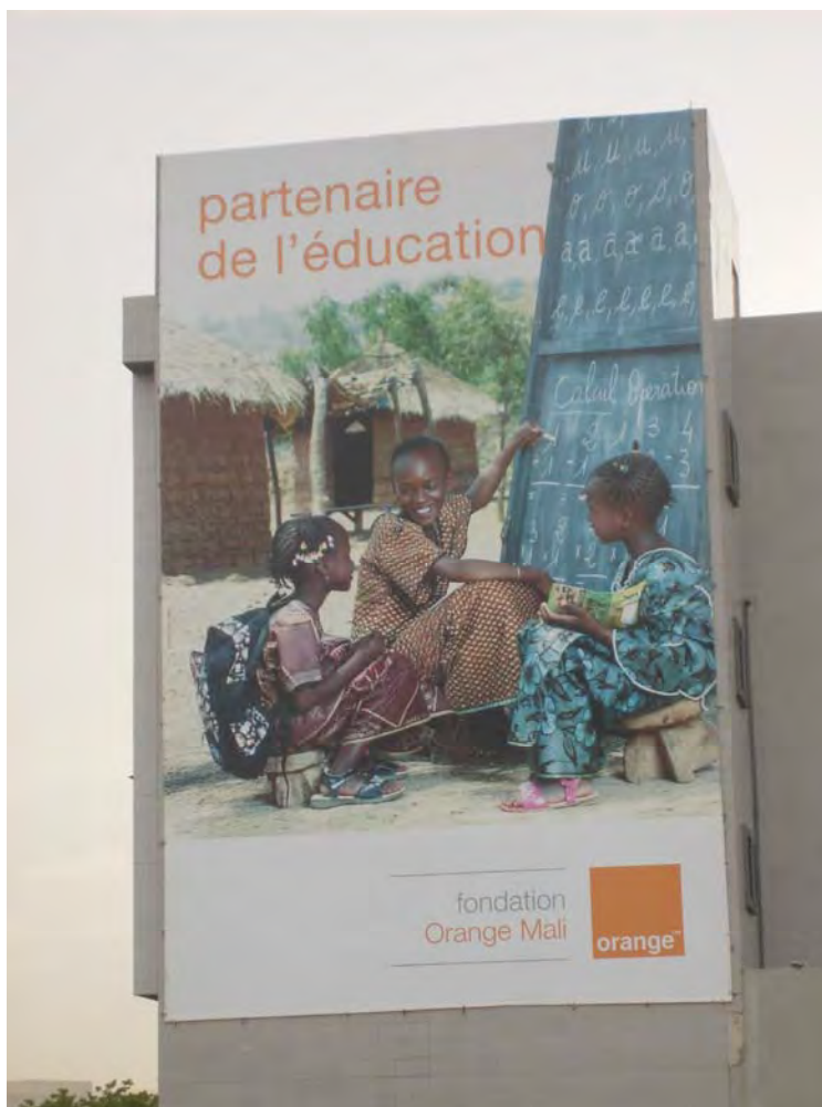
Photo 7.2 En investissant dans la publicité avec comme support des panneaux géants hissés sur le toit des maisons de particuliers en étage, Orange Mali exprime là une certaine forme de volonté de puissance ou d'expression de sa notoriété-proximité auprès des consommateurs.

Avant la participation de Maroc Télécom dans son capital, 9 la Sotelma employait directement 1 584 agents permanents, 122 stagiaires et générait indirectement près de 18 000 emplois à travers la gestion de 8 175 télécentres et cybercafés sur l'ensemble du territoire national. Aujourd'hui, l'effectif des employés a diminué de 35% par rapport à l'année 2008. 10