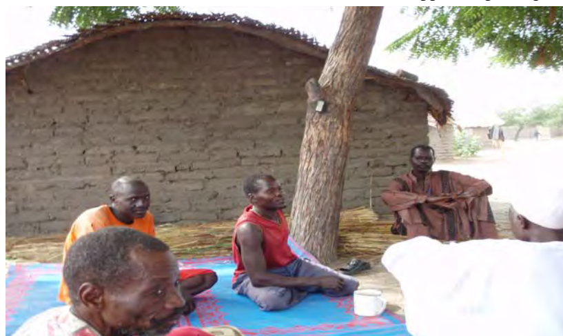
Photo 1.3 Une assemblée d'hommes attendant un appel téléphonique

toute la journée, les gens sont en état d'alerte: Les téléphones sont suspendus soit à un arbre, soit accrochés à une botte de paille. Durant toute la séance de causerie sous l'arbre à palabre, l'attention semble être plus portée à cet objet, comme c'est le cas de l'image ci-dessus.