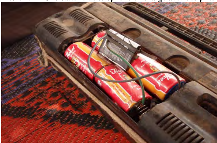
Photo 1.2 Une batterie de téléphone en charge avec des piles

dépit de réseau limité et capricieux: Téléphones accrochés aux branches d'arbres ou aux toits des cases pour capter le réseau, charges des batteries avec des piles à défaut d'électricité et de générateurs.