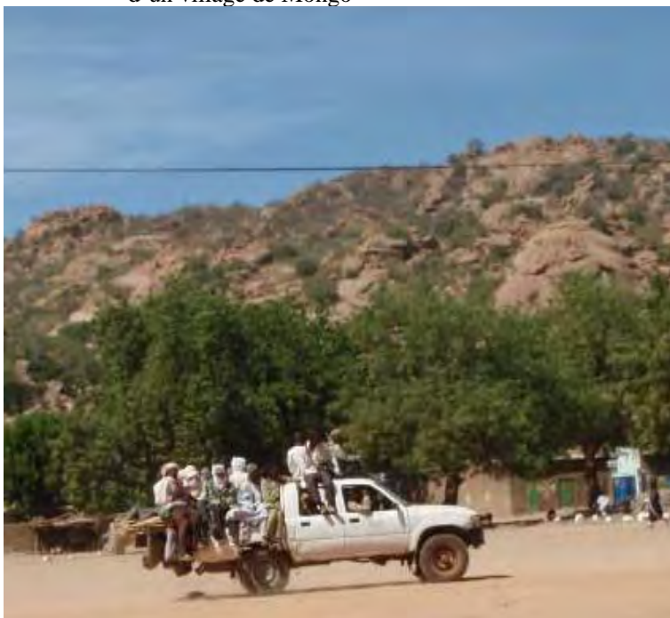
Photo 1.1 Un véhicule se rendant sur un marché hebdomadaire d'un village de Mongo

l'activité des 'coupeurs de routes', bandes armées au comportement souvent violent en raison notamment d'un fréquent usage de stupéfiants. 14