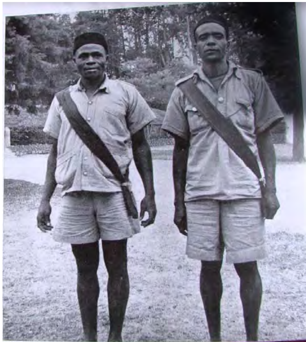
Photo 6.1 Two messengers in their official outfits