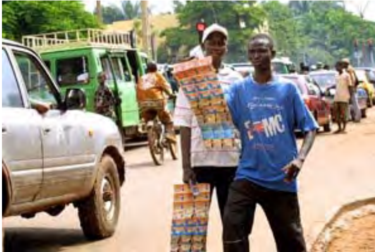
Photo 7.1 Si chaque société de téléphonie tient jalousement à ses produits et concepts l'espace public Bamakois est assez clairsemé de nombreux bricolages autour des usages de la téléphonie mobile. L'expression achevée de ces bricolages est la figure des vendeurs ambulants de cartes de recharger