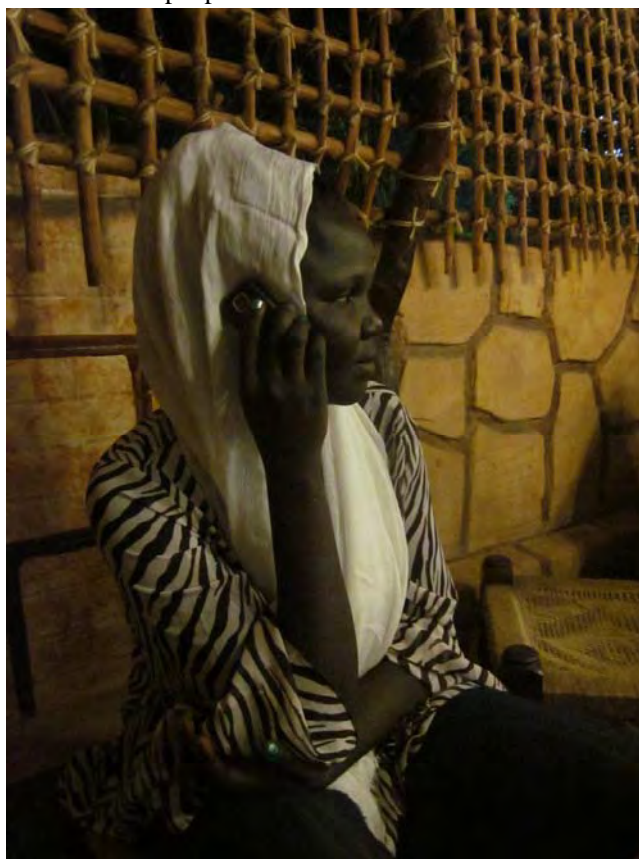
Photo 9.1 Nuba University student talking with people from the mountains

Nuba university students who have migrated to Khartoum are a marginalized group faced with the practical realities of participating in mainstream Sudanese life. On the one hand, they have a new urban consciousness where, when sitting in a lecture hall with hundreds of other students, one’s place of origin is less meaningful. On the other hand, as they make contact with the dominant culture,