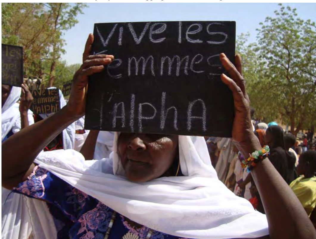
Photo 5.3 Les femmes hadjaraye se sont appropriées la technologie de savoir lire et écrire