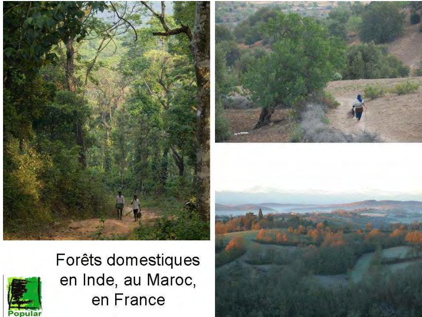
Forêts domestiques en Inde, au Maroc, en France