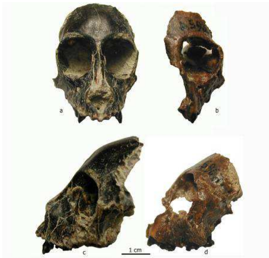
Figura 2. Comparación entre MPM-PV 5000, holotipo de Killikaike blakei (a, c), y MACN-A 5968, cráneo parcial de Homunculus patagonicus (b, d), en vista frontal y lateral. Son dos formas representativas del registro fósil patagónico, demostrando las diferencias morfológicas fundamentales entre cebinos y homunculinos primitivos mencionadas en el texto.

como ocurre en todos los platirrininos fósiles de Patagonia de los que se conservan restos craneales. Esta morfología ha sido interpretada como una característica que define al grupo patagónico como stem de los restantes Platyrrhini (Kay et al. , 2008; Kay y Fleagle, 2010); sin embargo, no se ha considerado la posibilidad de que sean, en realidad, características primitivas retenidas de potenciales ancestros del Viejo Mundo, ya que aquéllos conservan el mismo prognatismo típico de los primates primitivos, previos a la divergencia entre platirrininos y catarrinos. En este sentido, es esperable que el rostro prognato de Killikaike difiera del actual Saimiri y también de Cebus , y por otra parte ambos son portadores del rostro más reducido entre los primates del Nuevo Mundo. Esta característica acompaña la estrechez interorbitaria extrema (de modo que en Saimiri se forma también una fenestra en la pared interorbitaria) y el enorme desarrollo del cerebro anterior. Los molares superiores de Killikaike conservan similitudes con Dolichocebus , con crestas algo más marcadas que en Homunculus e hipocono bien desarrollado, pero que no igualan a Saimiri en su morfología general. Vale decir que las mayores similitudes con Saimiri se hallaron a partir de comparaciones de las órbitas y el hueso frontal sumado al endocráneo.