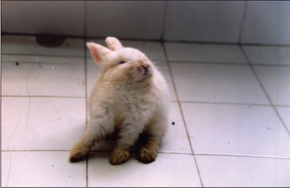
Figura 1. Conejo inoculado por vía intranasal con la cepa argentina A54 de BoHV-5. Signos neurológicos observados a los 8 días pos infección.