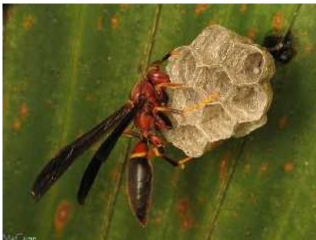
Slika 8. Matica vrste Polistes annularis polaže jaja

Sjeme koje je bilo pohranjeno ranije sada se koristi za oplodnju jajašca. Jedna kraljica je sposobna za izgradnju cijele kolonije sama. Kraljica u početku podiže prvih nekoliko setova jaja dok nema dovoljno sterilnih radnica za održavanje potomstva bez njene pomoći.