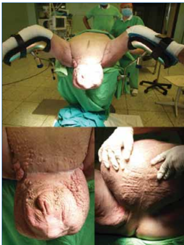
1. ÁBRA: AZ ELVÁLTOZÁS A KEZELÉS ELŐTT

A műtéti megoldást megelőzően elsősorban malignus daganat kizárása céljából a herezacskó biopsziáját végeztük (Bart biopty gun segítségével). A kórszöveti vizsgálat heges kötőszöveti átalakulást igazolt, ezen kívül egyéb kóros elváltozást nem mutatott. A műtéti