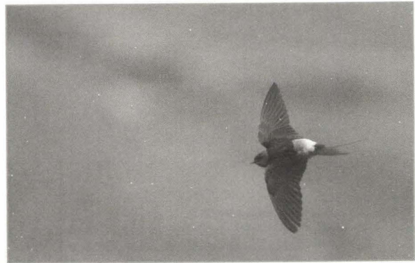
D'origine méridionale, la rare hirondelle rousseline a été observée à plusieurs reprises au printemps 2009, comme ici aux marais de Pouta Fontana, à Grône, le 29.04.2009.