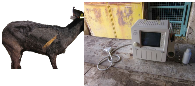
Figura 1 – Area de exploração ecográfica do tórax nos caprinos e ecografo utilizado.

Foi feito o exame clínico de uma cabra adulta com um quadro de tosse crónica e emaciação progressiva. O animal foi sujeito a exame ecográfico com um equipamento Aloka® Echo – Camara SSD- 500 e uma sonda de 5 MHz. Após aplicação de gel, o exame foi feito em estação com um transdutor linear. O tórax foi examinado nos planos longitudinal e transversal a partir do 6º ou 7º espaço intercostal. O membro posterior foi abduzido e a pele puxada cranealmente para permitir o acesso à região ventral do tórax. O exame entre o 9º e o 10º espaço intercostal permitiu avaliar o campo pulmonar dorsal e parênquima hepático (Figura 1).