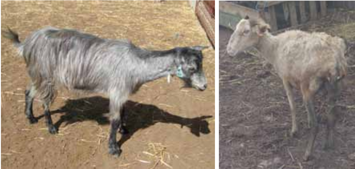
Figura 1 – Caprino e ovino com sintomatologia típica de paratuberculose

externos, até marcha cambaleante (devido à diminuição da massa muscular dos glúteos). Os estudos hematológicos podem revelar anemia normocrômica, hipoproteinemia, descida dos valores séricos de cálcio e magnésio (Kimberling, 1988). Tal como nos bovinos, pode ser observada uma melhoria dos sintomas durante a gestação (Brugère-Picoux, 1987). Outros sintomas notados são os problemas respiratórios com dispnéia e os abortos (Radostits et al. , 2007).