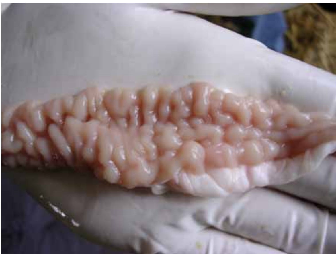
Figura 2 – Aspeto macroscópico típico da válvula ileo-cecal em ovinos com paratuberculose.

Os vasos linfáticos aferentes do mesentério podem aparecer dilatados e retorcidos, incluir pequenos nódulos de 1-4 mm e esbranquiçados, que podem evoluir até à caseificação ou, em determinadas ocasiões à calcificação. Nódulos similares ou manchas brancas podem observar-se sobre a superfície peritoneal do íleo, na superfície de corte da parede intestinal, ou nos gânglios mesentéricos e válvula íleo-cecal. Estes focos de necrose e caseificação nos linfonodos constituem uma característica que não ocorre em bovinos, sendo de apresentação frequente em ovinos. Os gânglios estão quase sempre aumentados e muito proeminentes (Gilmour e Angus, 1988).