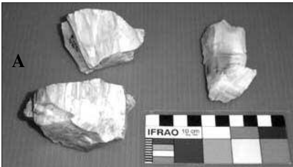
Figura 7. Núcleos provenientes de Cueva Maripe