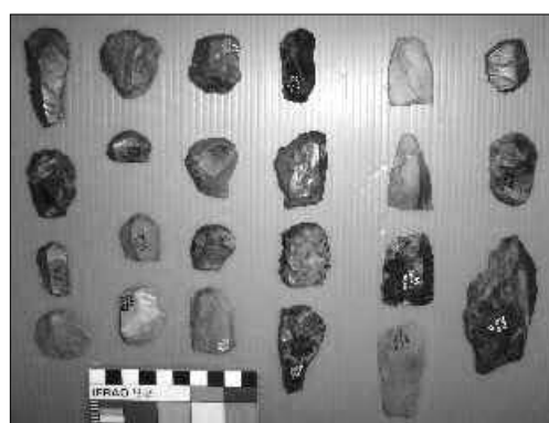
Figura 5. Artefactos formatizados de Cueva Maripe