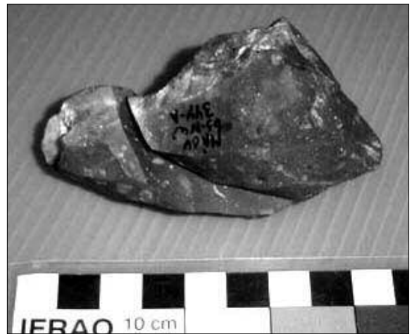
Figura 8. Detalle de núcleo remontado de Cueva Maripe (A, en Figura 7)

Sin embargo, en el caso de los AF sólo podría verse una estandarización en el largo de las piezas en el conjunto de CH, donde la frecuencia artefactual impone irrelevancia al cálculo. En caso de que hubiera existido una búsqueda de formas estandarizadas ésta sólo podría verse en el espesor de las piezas y en especial en MA donde se observa tanto en AF como en ANF, este patrón es coherente con los requerimientos morfológicos de piezas diseñadas para su empaque.