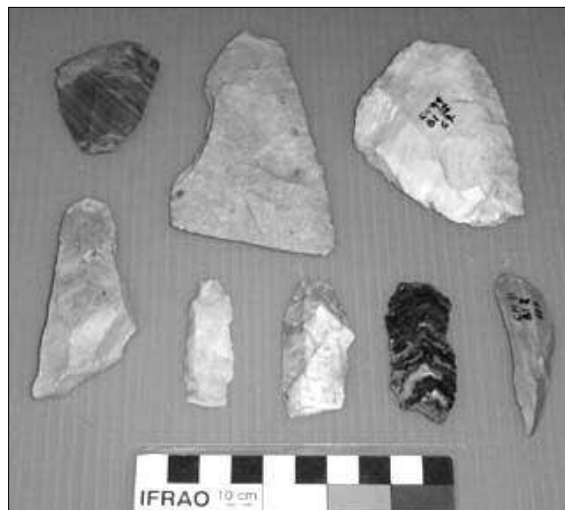
Figura 4. Artefactos no formatizados de Cueva Maripe