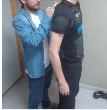
Figura 2. Colación del dispositivo inercial.

Los árbitros designados para arbitrar ambas finales conocían perfectamente el funcionamiento a seguir y accedieron a participar en el estudio, firmando un consentimiento informado. Antes de cada partido el árbitro fue monitorizado con las bandas de frecuencia cardiaca y los dispositivos inerciales encargados de registrar los datos (Véase Figura 2). La duración de cada partido fue de 20 minutos cada parte, realizando un descanso entre ambas. Tras la finalización de los partidos se elaboró una base de datos empleando el software de análisis estadístico SPSS v.21, donde luego se procesaron todos los datos recogidos.