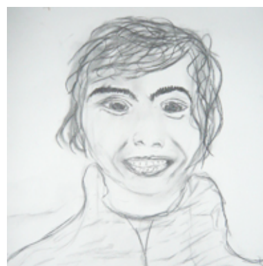
Processo e Resultados