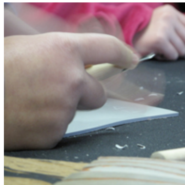
Criação de gravura