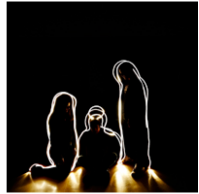
Resultados Finais: Fotografia

Técnicas de impressão: a sala de aula foi transformada num espaço expositivo aberto ao debate, não só sobre considerações e exemplificações relativas a algumas técnicas de impressão artística (serigrafia, gravura e linogravura), mas também acerca do papel destes processos na (re)definição do conceito de obra de arte como objecto único, irreprodutível.