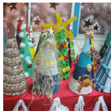
Resultados Finais: Assemblage

Fotografia: Com o auxílio de um profissional da área, os alunos foram conduzidos através de uma discussão orientada sobre a pertinência deste meio e de uma sessão de esclarecimentos acerca da diversidade de materiais e ferramentas fotográficas. Com a intenção de que a turma tomasse um contacto ainda mais directo com a técnica e explorasse as suas potencialidades, os alunos realizaram em grupo “desenhos de luz”, inspirados por Picasso - um dos percursores da técnica e por exemplos mais actuais como o light graffiti .