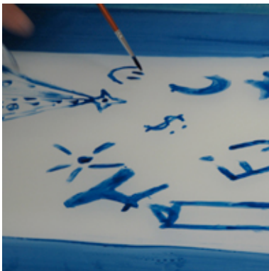
Criação de serigrafia

Eventualmente, desta forma, os alunos puderam adquirir uma visão mais elucidada, que lhes permitiu perceber que muitos destes meios “para fazer arte”, da assemblage à fotografia, passando por diversos tipos de reprodução de imagens, fazem parte de um vasto conjunto de técnicas que serviram e servem as áreas artísticas.