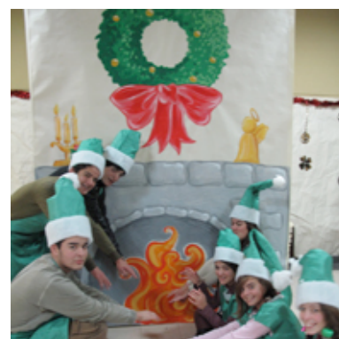
Resultados Finais: Fábrica do Pai-Natal