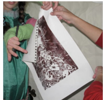
Resultado Final: Gravura

Mas, com a aproximação da época natalícia e a necessidade de enriquecer nos alunos o espírito de equipa e confiança (pois só um clima de cooperação mútua permite o auto-conhecimento e a sua revelação aos outros), não poderíamos ficar indiferentes a esta época de fantasia e magia. Assim e partindo das seis grandes directrizes da Educação Visual para o 3.º ciclo: