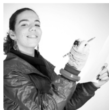
Resultados Finais: Eu numa lente