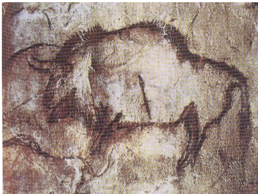
Fig. 1- Pintura Rupestre, Gruta de Altamira, Espanha, entre 18500-14000 anos a.C.

Ninguém pode desenhar o que não conhece, o que não experimentou, o que não faz parte do seu sentir, do seu pensamento visual, das suas referências pessoais. O desenho implica todo o ser: físico e mental. Por isso, o desenho ajuda a entender a realidade e a redimensionar o mundo interior. É um instrumento de comunicação, através de pontos, de linhas, de formas, de sombras e luzes, que nos faz entender o mundo que conhecemos, o espaço em que vivemos, o que idealizamos, ou a que aspiramos.