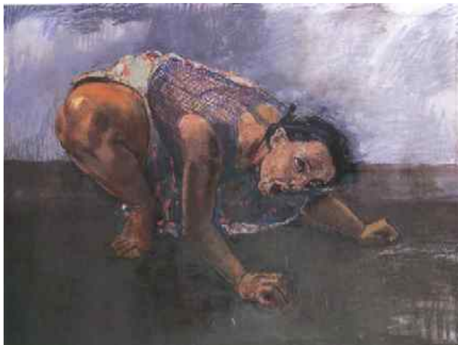
Fig. 2. Paula Rego, Mulher cão , pastel seco s/ alumínio (1994) Tate Gallery.

Para além destes fatores, a percepção visual da forma desenhada e a sua representação são individuais e são fruto duma prática e duma cultura visual adquirida que não podem ser imitadas, porque são sempre diferentes.