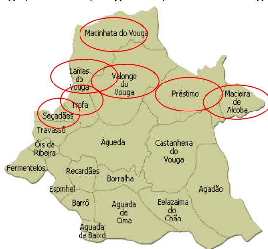
Figura 3: Mapa do concelho de Águeda e respectivas freguesias, estando assinaladas as freguesias da área de abrangência do Agrupamento de Escolas de Valongo do Vouga.

Actualmente, a Escola n.º2 de Valongo do Vouga é sede de um Agrupamento de Escolas constituído, para além da EB2,3, por 9 jardins-de-infância e 9 escolas básicas do 1º ciclo, distribuídas pelas 7 freguesias que constituem a área de abrangência do mesmo – Lamas do Vouga, Macieira de Alcoba (a única freguesia sem estabelecimentos de educação), Macinhata do Vouga, Préstimo, Segadães, Trofa e Valongo do Vouga.