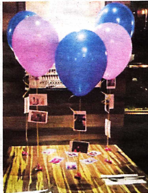
Antara perkhidmatan dekorasi acara yang ditawarkan Husna Mastura melalui Balloon Mania .