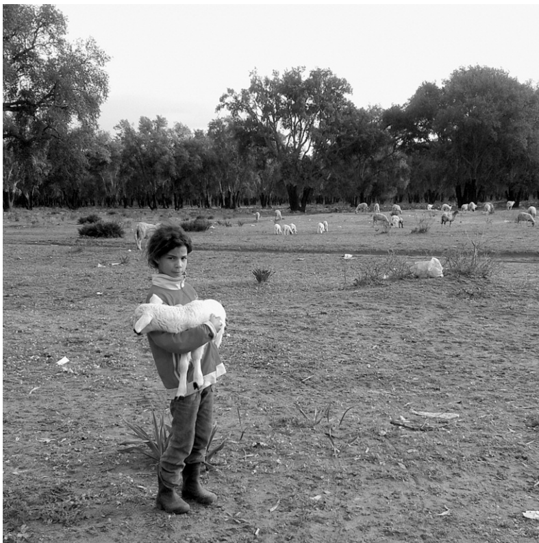
Photo 3 : Fillette auprès d'un troupeau ovin. Au fond, la forêt de chêne-liège de Séhoul

aromatiques et médicinales, des glands, etc. C'est pour cela qu'elles sont considérées comme l'agent principal en contact direct avec les ressources naturelles. Elles sont aussi les premières à subir les conséquences de l'appauvrissement de leur terroir, car elles constituent la catégorie la plus pauvre et la plus vulnérable. De ce fait, dans le cadre d'un développement durable, lié aux préoccupations relatives aux ressources naturelles qui doivent être bien gérées pour ne pas compromettre le potentiel des générations futures, on peut dire que l'implication des femmes, au même titre que celle des hommes, dans le processus de décision, apparaît très utile pour la durabilité des ressources naturelles dans la zone d'étude.