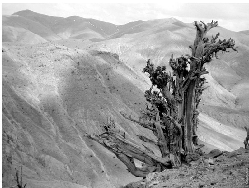
Photo 1 : Genévrier thurifère dans le Haut Atlas oriental au Maroc

La péninsule ibérique abrite de nombreux peuplements, formant un arc de la cordillère cantabrique au nord-ouest, jusqu'au sud-est de l'Espagne. Au total, le thurifère couvre plus de 125 000 ha en Espagne, ce qui représente 1% de la surface forestière espagnole.