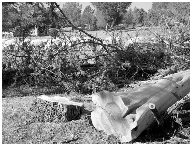
Photo 8 : Exploitation du Genévrier thurifère dans la région de Soria (Espagne)

Bien que les études génétiques aient permis de déterminer les principaux mystères de la systématique du thurifère, des questions d'ordre toponymiques font encore surface. On l'a appelé la Sabina, la Trabina en Espagne, le Soliou en Corse, ou encore la Sabina arborescente, la Galica, le Cade, la Chinette, le Savin, dans les Alpes du Sud (communication L. VILLAR et M. SANZ et com-