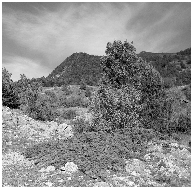
Photo 5 : Le Genévrier thurifère, ici en association avec un genévrier rampant : le sabine (Forêt de Saint-Crépin)

La taxonomie de Juniperus thurifera s'étudie à différents niveaux. L'étude morphologique est le premier utilisé car elle est facilement réalisable. Elle consiste en l'étude à la fois de l'appareil végétatif et de l'appareil reproducteur. Actuellement, les galbules (taille et forme des galbules et nombre de graines) et les feuilles (forme squamiforme) sont les principaux critères utilisés pour son identification. La différenciation en deux sous-espèces thurifera et africana (communication A. ROMO et al. ) est communément admise, le détroit de Gibraltar étant une barrière biogéographique efficace. Les données génétiques permettent cependant aujourd'hui d'affiner cette structure taxonomique, notamment pour les populations des Aurès (encore trop peu étudiées) pour lesquelles les individus présentent une ressemblance morphologique avec la sous-espèce africana des Atlas marocains, mais sont génétiquement plus proches de la sous-espèce thurifera (communication E. VELA et T. GAUQUELIN). Une nouvelle taxonomie pour J. thurifera doit ainsi être proposée. Pour cela, il faudrait, d'une part, étudier davantage la dispersion des graines par les oiseaux pour mieux comprendre la répartition du Genévrier thurifère. D'autre part, pour amé-