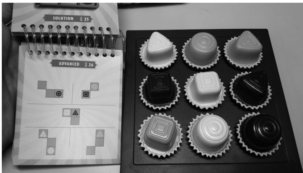
図1 Chocolate Fixの写真