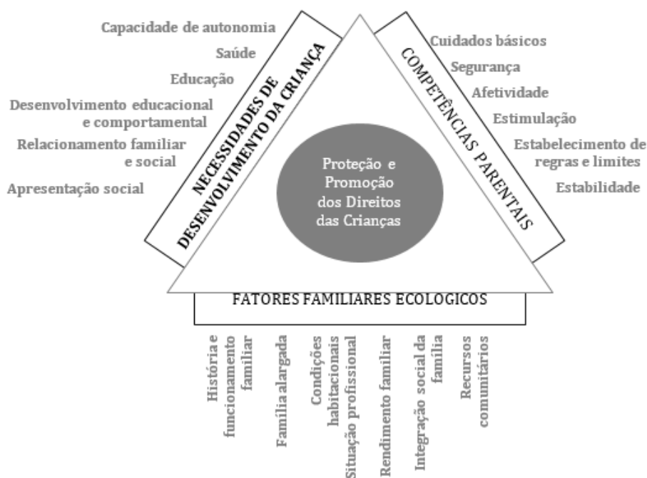
Figura 1. Modelo Ecológico de Avaliação e Intervenção em Situações de Risco e de Perigo adaptado de Department of Health, Department for Education and Employment, Home Office (2000).

O processo de tomada de decisão é complexo e não assenta apenas em conhecimentos profissionais claros ou linhas orientadoras explícitas (Drury-Hudson, 1999). Fatores pessoais e situacionais podem influenciar a posição de cada profissional face a uma situação específica de maus-tratos (Wells, Lyons, Doueck, Brown, & Thomas, 2004).