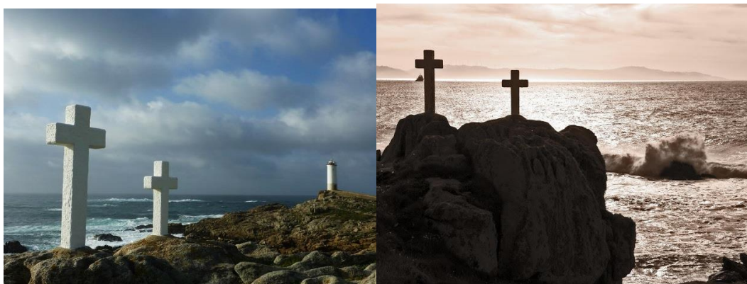
Figura 7 – Cruzes memoriais em Punta Roncudo (Fotos 13 e 14)