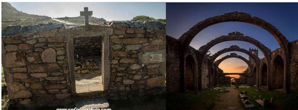
Figura 6- Cemitério dos Ingleses (Foto 11) e o Cemitério de Santa Mariña-Camariñas (Foto 12)