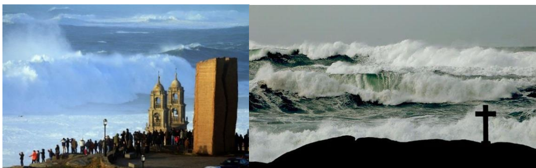
Figura 3- Temporais, ondas gigantes em Muxia e Camariñas (Fotos 5 e 6).