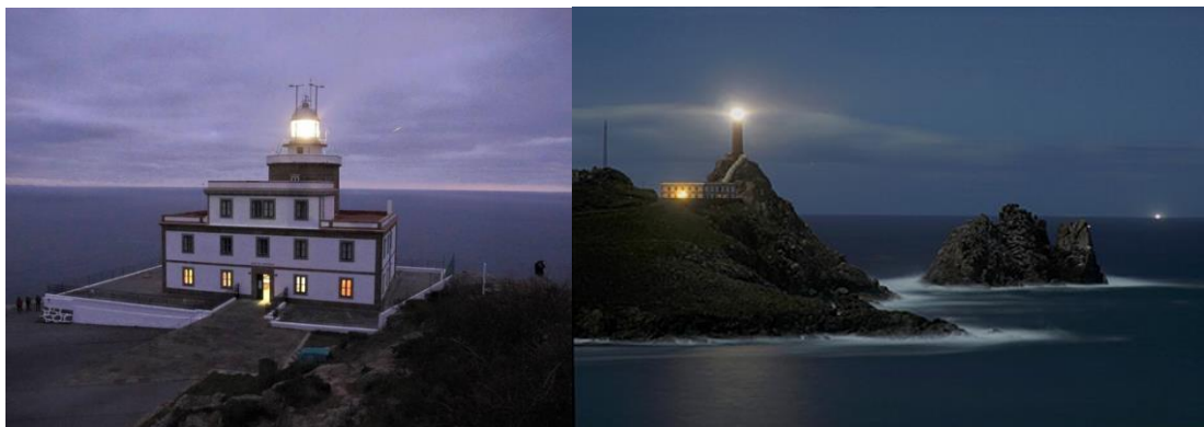
Figura 2- Farol de Cabo Vilan (Fotos 3 e 4).