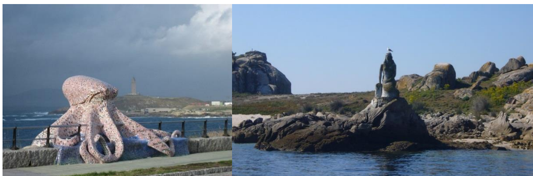
Figura 8 – Monstros marinhos: ex: Polvo - Corunha (Fotos 15) e Sereia- Ilha Salvora (Foto 16).