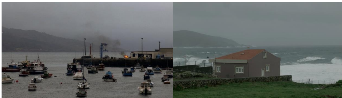
Figura 9- Paisagem distópica dos filmes “Costa da Morte” (Foto 17) e “Penumbria” (Foto 18)