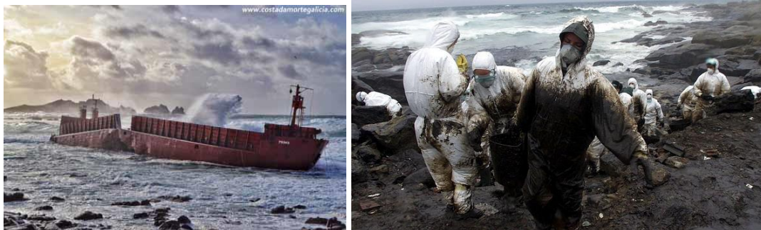
Figura 4- Naufrágios: O Prima encalhado na praia de Riera (Foto 7) e o desastre do petroleiro Prestige (Foto 8).