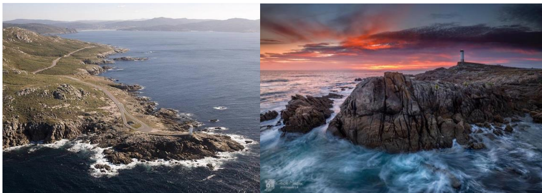
Figura 1- Farol de Punta Runcudo (Fotos 1 e 2).