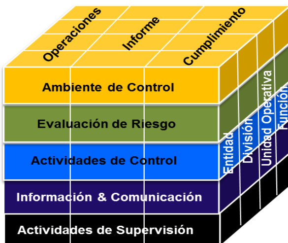
Figura No. 1 Componentes del Control Interno