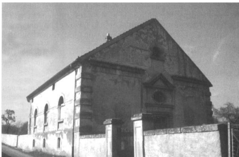
Ancien temple de Courcelles-Chaussy.

Courcelles-Chaussy, lieu de mémoire du protestantisme, peut s'enorgueillir de posséder un temple qui pourrait être qualifié de « chapelle palatine ». En effet, l'empereur Guillaume II, qui résidait volontiers au château d'Urville - actuel Lycée agricole -, décidait en 1894 de faire élever un temple dans la commune de Courcelles. La mode est au néo-gothique, et malgré l'existence d'un ancien temple, devenu trop modeste, élevé au début du siècle, donc « française », un nouveau bâtiment est projeté.