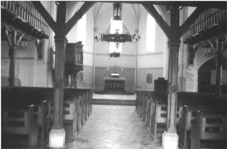
Temple de Courcelles-Chaussy : intérieur.