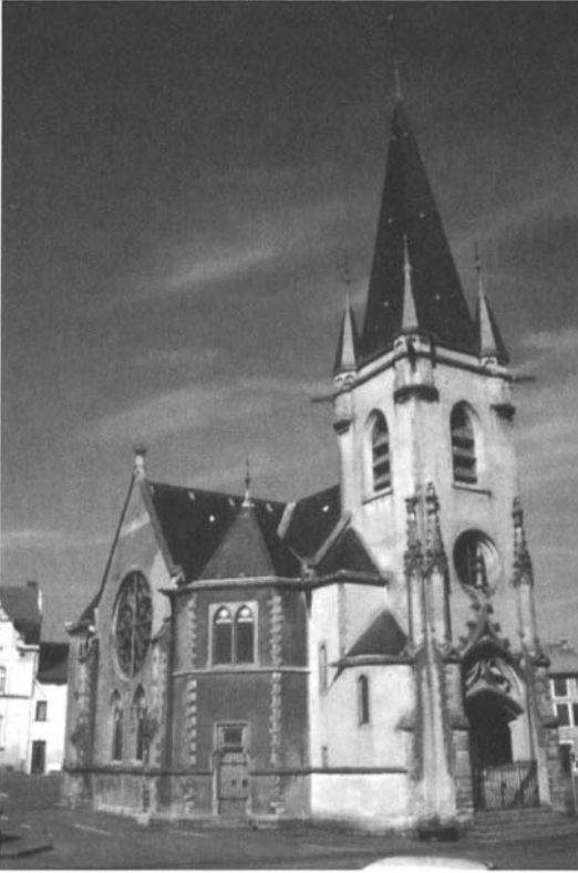
Temple néo-gothique de Courcelles-Chaussy.