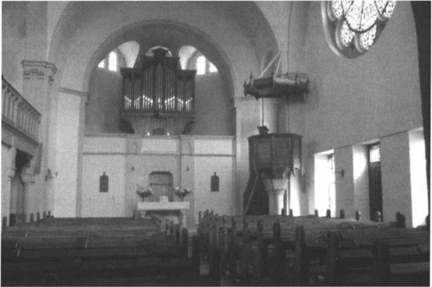
Temple de Queuleu : intérieur.

Cependant, la lumière peut pénétrer largement dans l'édifice grâce aux roses du faux transept et aux fenêtres distribuées dans la nef et sur la façade.