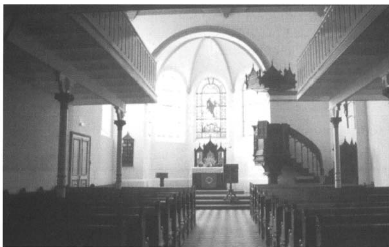
Temple de Metz, rue Mazelle : intérieur.

Les orgues sont disposées au revers de la façade. Sur la chaire, adossée au mur extérieur du chœur, une inscription en allemand célèbre la pierre d'angle qu'est le Christ. Dans le chœur polygonal, la table de communion porte à la fois un triptyque et une croix habitée. Le triptyque est une œuvre en bois qui porte en son centre une tête de Christ souffrant, finement gravée, alors que de part et d'autre se disposent des épis de blé accompagnés d'une patène et des ceps de vigne sortant d'un calice. La croix et le triptyque accentuent le rapprochement de la table de la Sainte Cène avec un autel.