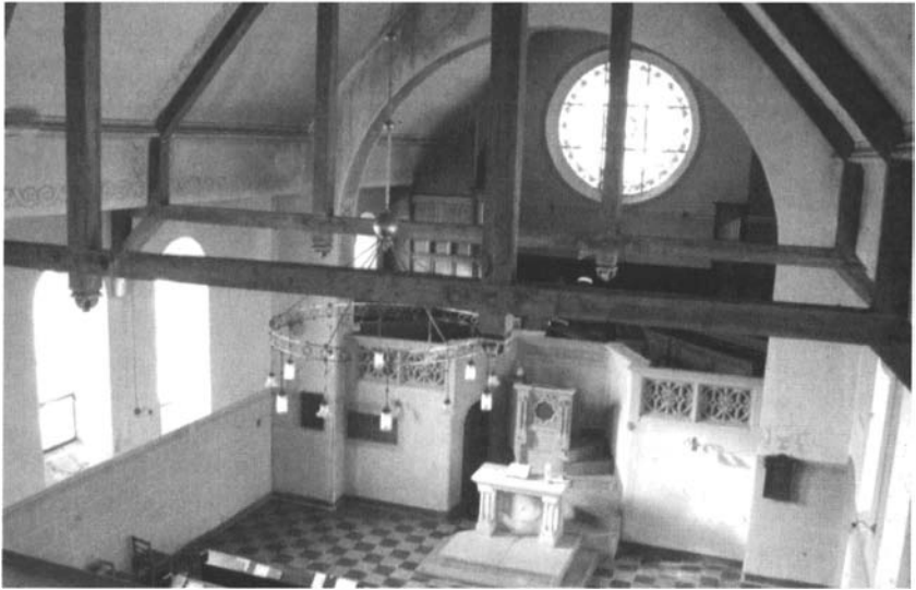
Temple de Longeville-lès-Metz : intérieur.

chevelure, aux joues rebondies, sourient ou s'étonnent, tournées vers le spectateur.