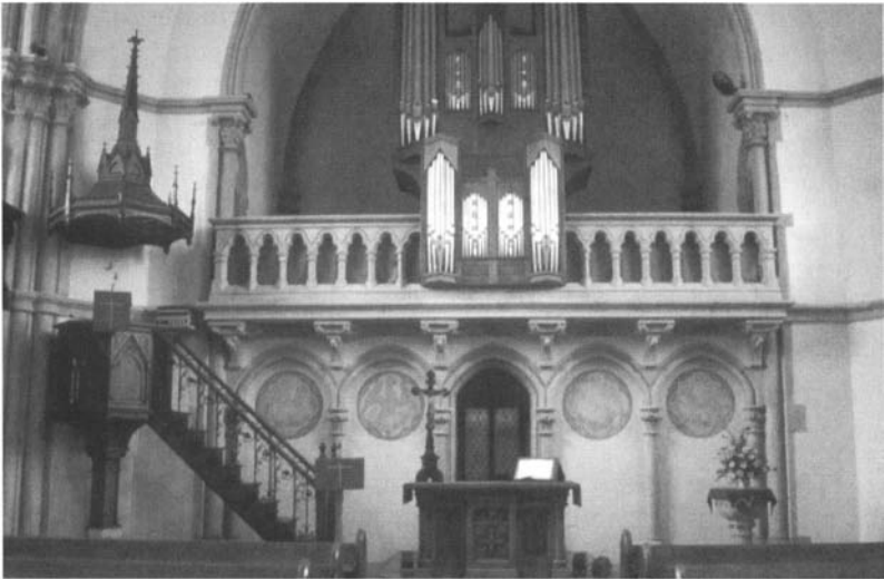
Temple de Montigny-lès-Metz : intérieur.

L'édifice, surmonté en façade d'un clocher élancé, se dresse fièrement à l'entrée du bourg, à un carrefour de rues. Le petit jardin, situé devant le portail, atténue la sévérité de l'église.