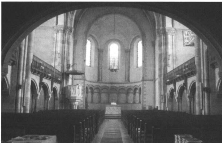
Temple Neuf de Metz : intérieur.

L'édifice est couvert d'une voûte à croisée d'ogives. Comme à l'extérieur coexistent les références gothiques et romanes : gothique est l'architecture, roman le décor. Dans le transept, des corbeilles ottoniennes se logent sous des têtes royales masculines et féminines. S'il n'est pas question de reconnaître des portraits impériaux dans ces sculptures, on ne peut, toutefois, nier le renvoi au Saint-Empire romain germanique, dont Guillaume II se voulait le continuateur. L'Empereur assistera - ce qui n'est pas neutre - à l'inauguration du temple. - On peut noter que dans la gare de Metz, de style néo-roman, l'Empereur s'était réservé des salles et que là aussi la référence aux grands prédécesseurs, Charlemagne en l'occurrence, a été nettement affirmée.