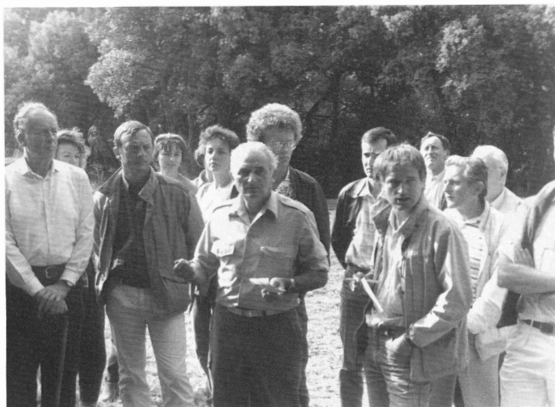
Le groupe Gestion en tournée.

La proximité des grands axes de communication provoquent une nuisance non négligeable : le bruit. Garder un couvert végétal élevé et touffu lui fait quelque peu obstacle. Dès lors, une seule préoccupation