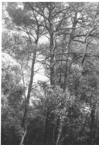
Un souci : préserver l'esthétique du site en gardant les grandes cimes.

pour le gestionnaire : protéger son site des flammes. Un seul moyen d'y parvenir à ses yeux : débroussailler. Un programme Feoga le permet. Mais que va-t-il se passer maintenant ? Pour garder son efficacité, il faut que le débroussaillage soit entretenu. Se pose de nouveau le problème des moyens.