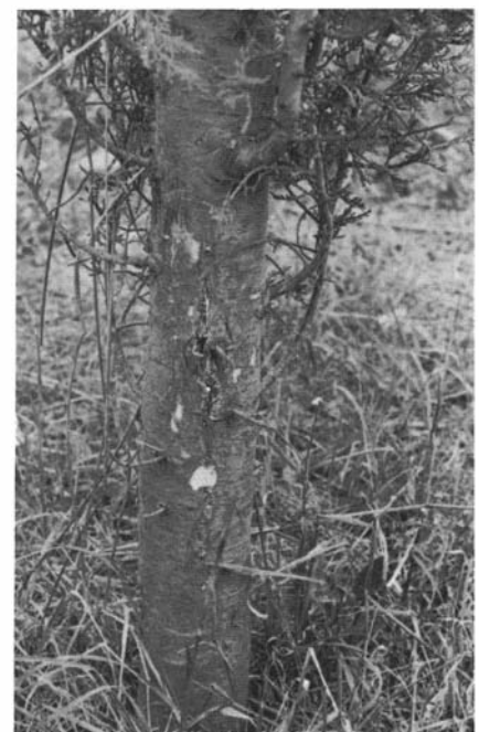
Photo 10. — Chancre superficiel de l'écorce du Cupressus dupreziana .

On ne sait presque rien de la sensibilité des espèces asiatiques; à Fos, C. funebris est resté indemne, C. torulosa présente quelques chancres à évolution variable selon les sujets. Aucune mention