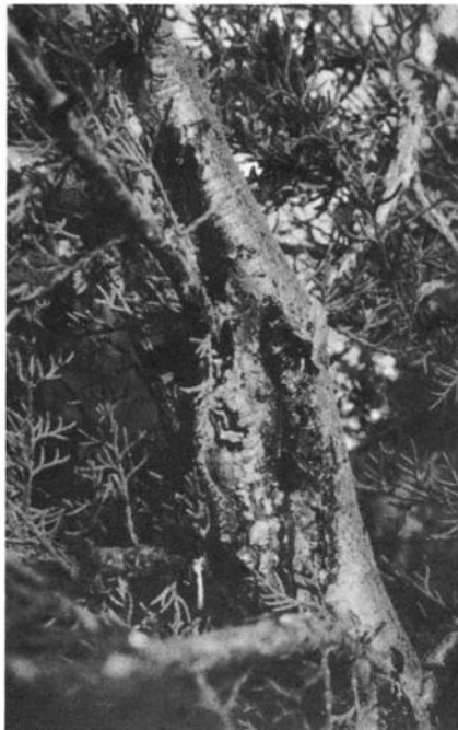
Photo 3. - Chancre évolué ceinturant presque complètement le tronc.

fous dans les craquelures de l'écorce qui sont très caractéristiques de la fructification du parasite. En périodes humides il en exsude des gouttelettes noires, masse de spores engluées dans du mucus, dont l'observation microscopique lève tous les doutes.