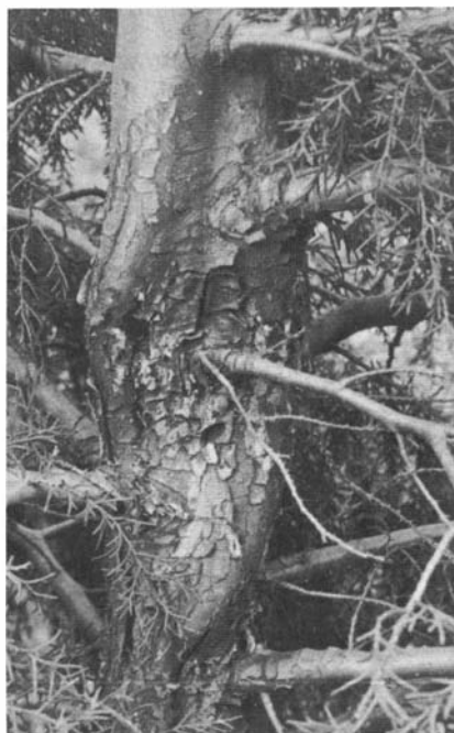
Photo 8. — Chancre déformant, à évolution lente sur Cupressus lusitanica .

Le tableau 1 montre aussi que les espèces américaines C. forbesi ,