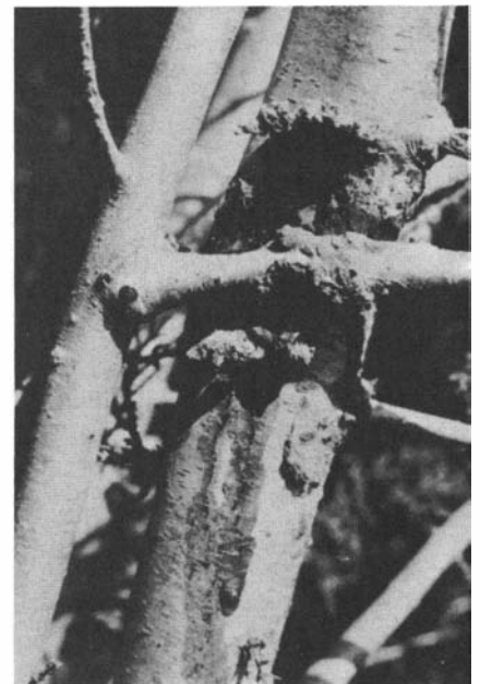
Photo 5. - Blessure par frottement de tiges.

Les portes d'entrée sont très diverses : plaies de taille, fissures au