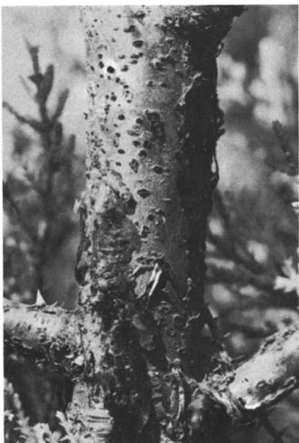
Photo 2. - Fructifications de type acervule du Coryneum .

prenant une forme allongée, lenticulaire, trois fois plus longue que large. Au fur et à mesure de son extension elle libère de plus en plus de résine, dont le flot s'écoule le long du tronc. Cette coulée de résine est un indice et une forte présomption de la présence du parasite; il faut rapidement vérifier s'il ne s'agit que d'une blessure par frottement ou du développement du chancre. Ce dernier, au bout de quelques semaines, traduit sa croissance par la formation sur les tissus morts, de petits cratères noirs (acervules) superficiels ou en-