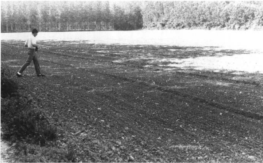
Photo 9 : Alternance agriculture - peupleraie. Au fond : peupliers 4551