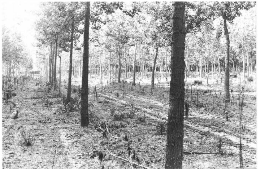
Photo 7 : Peupliers de 5 ans sur précédent maïs. Hétérogénéité due aux lapins

Les cultures pratiquées sur les 25 hectares sont essentiellement des cultures légumières de plein champ (melons, tomates...)