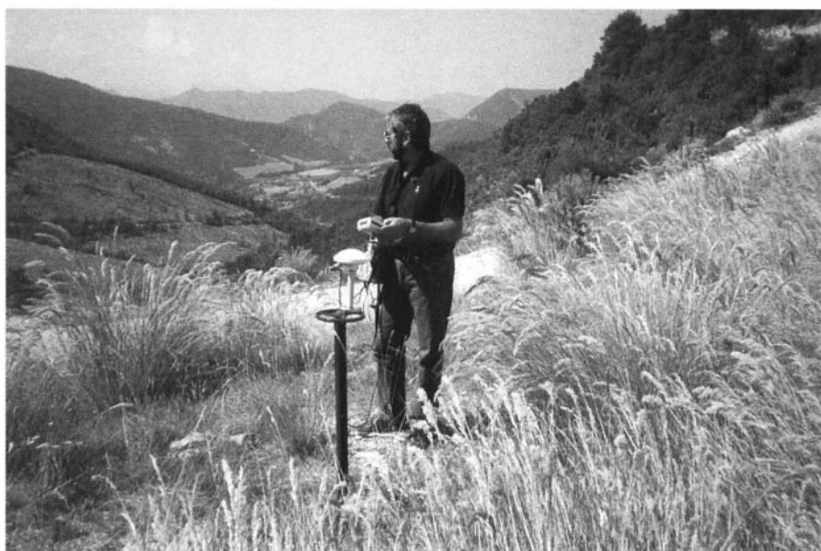
Positionnement d'une citerne DFCI enterrée au Global Positioning System (GPS)

Cet outil s'adresse aussi bien aux services de commandement opérationnels (S.D.I.S., C.I.R.C.O.S.C., C.O.S.), qu'aux services forestiers de l'état (D.D.A.F., O.N.F., C.R.P.F...) et aux divers financeurs (état, régions, départements, Communauté européenne...). La démarche poursuivie se développe en trois temps :