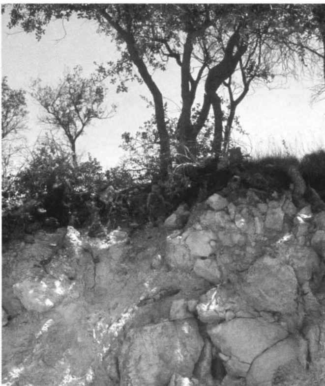
Photo 2 : Dans une forêt en équilibre, la matière organique du sol présente un stock de carbone très supérieur à la biomasse vivante. Sur les anciens terrains agricoles, la reconstitution de ce stock est un important puits potentiel de carbone.

- et de comparer les coûts/bénéfices globaux pour notre pays avec ceux des investissements qui sont faits par ailleurs en terme de plantations, ou ceux d'autres investissements dans la lutte contre l'effet de serre.