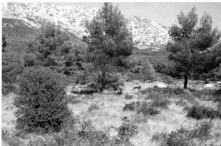
Photo 1 : Forêt spontanée envahissant les terres agricoles abandonnées. Près de 10 000 ha/an sont ainsi conquis chaque année dans la seule région Provence-Alpe-Côte-d'Azur

Elles sont le résultat de négociations dans le cadre des réductions de gaz à effet de serre, pour lesquelles les pays s'échangent et se monnayent des