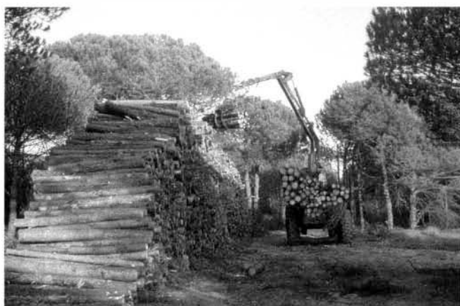
Photo 3 : Sans un minimum de gestion, les forêts spontanées fournissent surtout du bois de papeterie ou de feu. Le carbone fixé par les arbres retourne dans l'atmosphère par brûlage ou dégradation en moins d'un an...

- de chiffrer la fixation de carbone dans les différentes par-