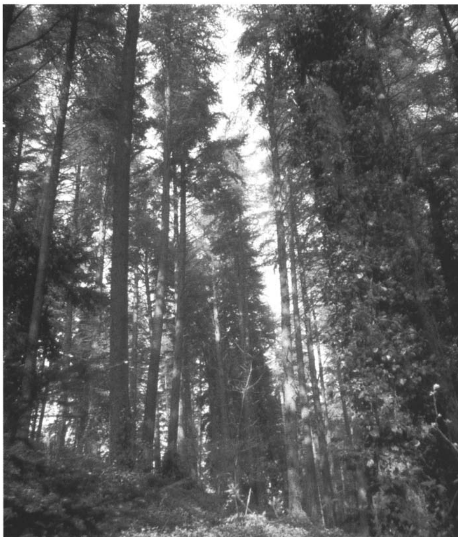
Photo 2 : Forêt de cèdre du Rialsesse : cette provenance artificielle française est l'une des plus vigoureuses en plantation comparative