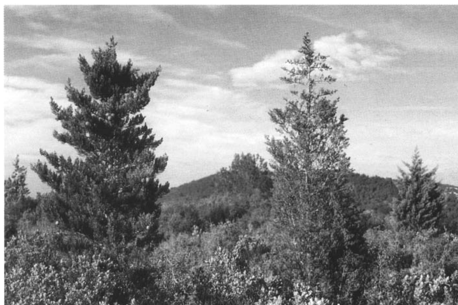
Photo 1 : La variabilité des individus : une origine génétique et des effets du milieu. Plantation comparative pour la résistance du cyprès vert au chancre coloré à Vitrolles (Bouches-du-Rhône)

La démarche scientifique développée par les généticiens forestiers consiste à établir un protocole expérimental qui permette de donner une