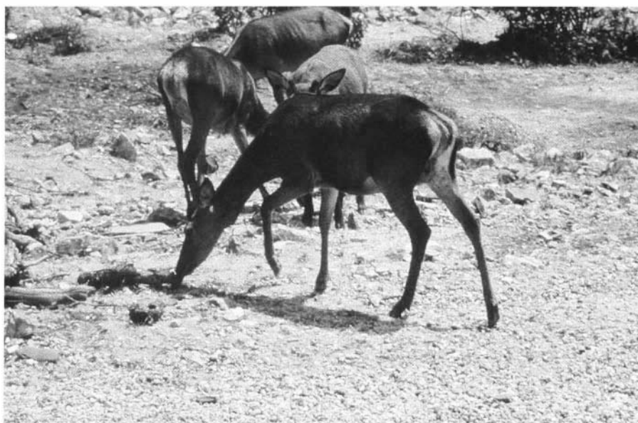
Photo 2 : Le Cerf élaphe est l'espèce de grand gibier la plus importante des Montes.

6.3.2. "Las Rozas" est une technique qui consiste à couper la végétation de la strate arbustive dans certains endroits où celle-ci est très haute et