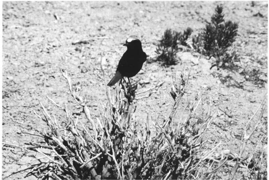
Photo 2 : Le peuplement d'oiseaux en milieu méditerranéen est caractérisé par l'abondance d'espèces de milieux ouverts (rochers, pelouses, steppes) comme ce traquet à tête blanche

La déprise agricole, aboutit en l'absence d'incendie à un stade forestier qui conduit inéluctablement à la disparition définitive ou à la raréfaction extrême de tout un groupe d'espèces remarquables de la faune de France. Il importe donc de favoriser une mosaïque de milieux, en sauvant la forêt méditerranéenne mais en maintenant également des pelouses rases ou parsemées de buissons en empêchant une colonisation trop rapide par des arbustes. Ce maintien est nécessaire à la survie de l'Aigle de Bonelli, du Traquet rieur, à plusieurs