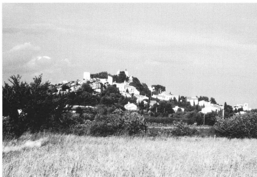
Photo 3 : La biodiversité d'une région résulte d'un équilibre fragile entre contraintes environnementales et activités humaines. L'abandon de l'agriculture en zone difficile, suivi d'une fermeture du milieu serait préjudiciable à de nombreuses espèces caractéristiques de la région - village d'Eygalières.

Dernière étape en date, l'adoption en 1992 de la directive 92/43 C.E.E. dite "Habitat Faune Flore" qui prévoit à la fin de ce siècle l'instauration d'un réseau cohérent d'espaces protégés appelé "Natura 2000". Ce réseau vise à sauvegarder des habitats particuliers pour eux-mêmes (par exemple, forêts sclérophylles méditerranéennes) ainsi que des habitats d'espèces animales ou végétales particulières. Dans les prochaines années, un immense travail d'inventaire sera conduit sous l'égide du Secrétariat Faune et Flore.