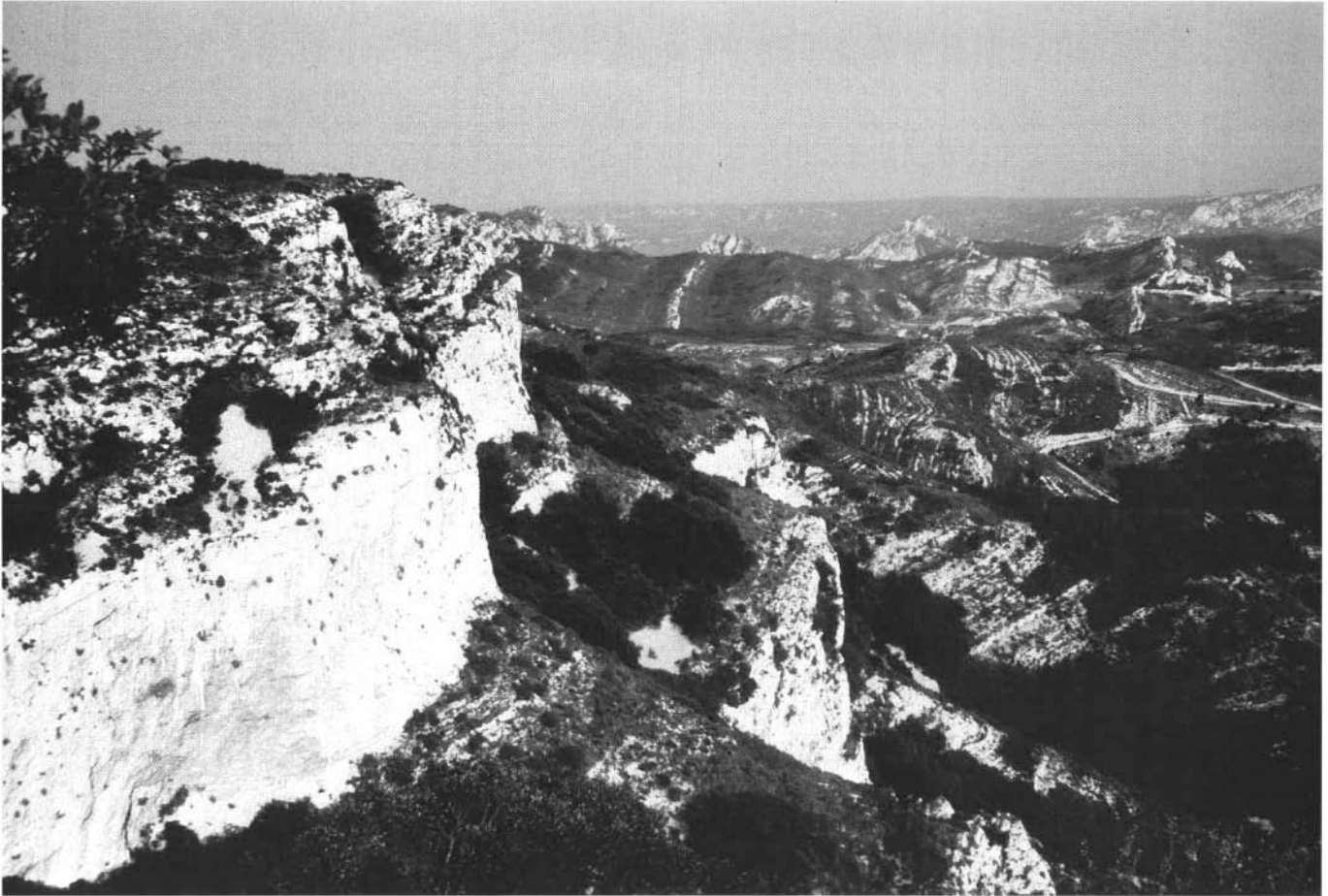
Photo 1 : Alors que les pays du Maghreb veillent à limiter la déforestation, les milieux méditerranéens français, soumis à la déprise agricole, se ferment progressivement, devenant ainsi impropres à la survie d'espèces comme l'Aigle de Bonelli - falaises des Alpes.