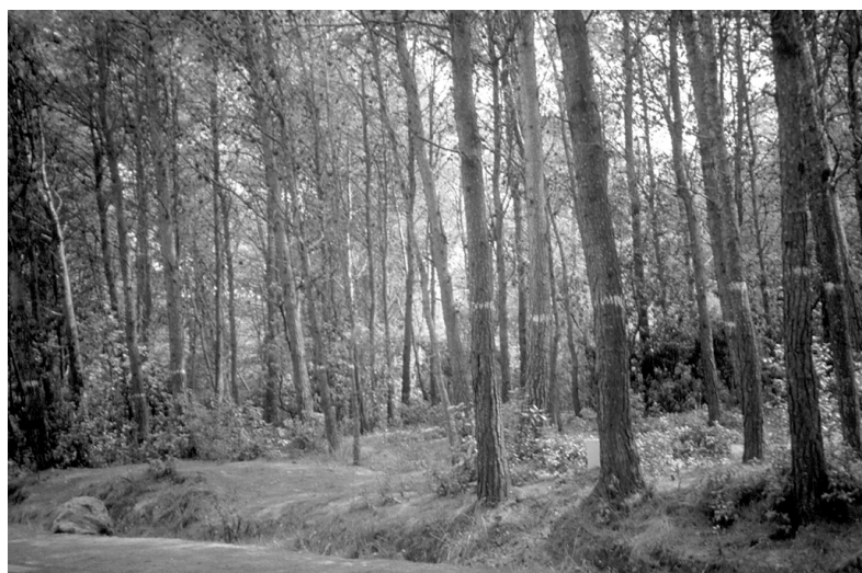
Photo 2 : Peuplement de pin d'Alep dans l'arboretum de Bainem (Alger)

Suivant la loi musulmane, les forêts étaient la propriété du " Beylik ", donc de l'État, et c'est en vertu de cette disposition que le " Senatus Consulte " du 22 avril 1863, intégra celles-ci dans le domaine de l'État. Selon SARI [33], suite à l'instauration de cette loi, des soulèvements ont éclaté, suivis de mises à feu. À plusieurs reprises, des incendies de forêt éclatèrent, dont les principales dates sont 1872-1873, 1882, 1892, puis 1902-1903, suite à la promulgation du Code forestier et encore en 1913, 1935, 1948. Pour