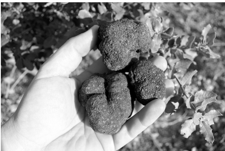
Photo 1 : Truffes nobles ( Tuber melanosporum ) "cavées" en forêt méditerranéenne...

La truffe noire est un champignon hypogée de la famille des Tubéracées, classe des Ascomycètes. Son mycélium vit en symbiose avec diverses espèces forestières, particulièrement le chêne vert ( Quercus ilex ) et le chêne pubescent ( Quercus pubescens ) en zone méditerranéenne. Le mycélium s'associe aux racelles de l'arbre pour former des mycorhizes. La truffe proprement dite est un ascarpe, la fructification du champignon.