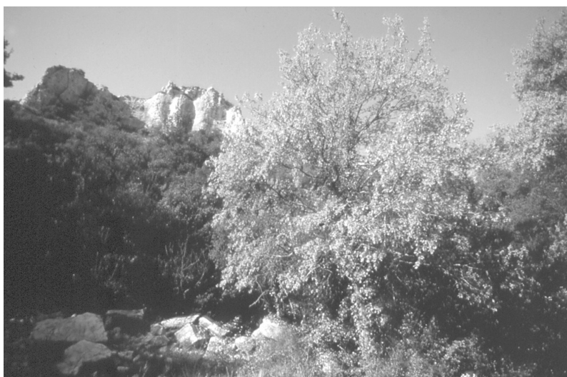
Photo 3 : Erable de Montpellier dans la forêt domaniale du petit Luberon

ger, au moins au niveau expérimental, d'installer les feuillus sous un peuplement résineux clair (Pin d'Alep ou Pin Maritime dans les Maures). L'abri fourni pourrait être déterminant pour la réussite des reboisements.