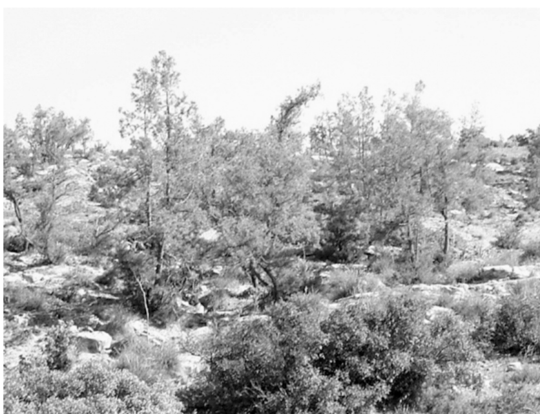
Photo 2 : Rejets de souche de Tetraclinis articulata après incendie