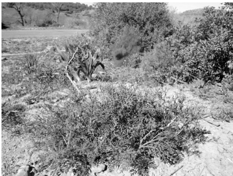
Photo 3 : Rejets de souche de Tetraclinis articulata