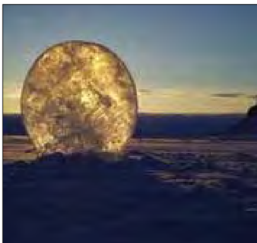
Figura 2. Lent de gel, Ackroyd i Harvey (2005)

“En Dan i jo vam esculpir un tros de gel glacial que vam serrar i transportar fora del mar glaçat fins a una gran lent en forma de disc. Teníem l’esperança que concentrés feixos de llum solar, i que potser desfaria la neu o socarrimaria fulls de paper. Doncs no va ser així, el sol era baix i feble però la lent glacial va esdevenir un atrapa-sol que presentava un mosaic de llum esberlat i antic. En Dan va fer una càmera fent servir una tallada de gel, col·locant-la darrera de la lent en un bloc de neu. La imatge del sol i les muntanyes llunyanes semblaven una aparició invertida en un full de gel glacial.” 10