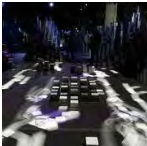
Figura 4. High Arctic , Matthew Clark i United Visual Artists, vista de la instal·lació del Museu Marítim Nacional, Londres (2011)

Svalbard que desapareixerà per culpa de l'escalfament global, trepitgen bassals de neu que giravolta, punxades blanques que formen remolins al voltant de la base de les columnes blanques abans d'allunyar-se de nou, que giravolten al voltant dels peus dels visitants abans de dissoldre's en les masses negres. Passant les llanternes pels mapes de llum fets amb línies de contorns, els focus blaus se situen en una gran bassa negra situada entre masses blanques altíssimes, mentre les llanternes es mouen per les columnes glacials, una massa d'icebergs geomètrics basats en la llum penetra en la negror. Guiats per corrents invisibles que dirigeixen el moviment de les llanternes, la bassa esdevé una massa colèrica de formes que s'ajunten, es divideixen, es desplacen pel terra com si fossin grans masses blanques que acaben desapareixent en la llunyania. Dirigint els fluxos i intensitats d'aquests icebergs geomètrics amb els recorreguts que fan les llanternes, animant els alts i baixos dels remolins de neu en l'espai, el públic interactua amb els paisatges abstractes d'aquesta instal·lació. 13