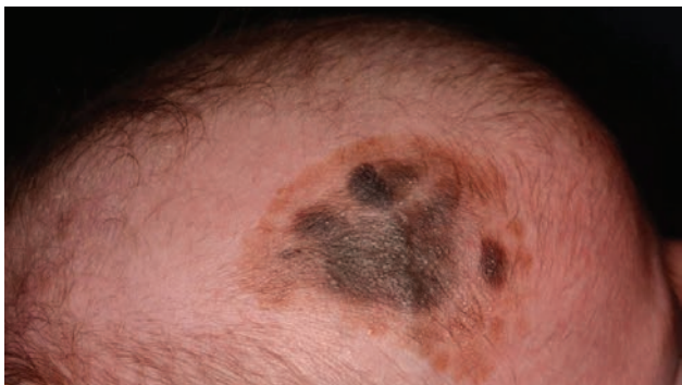
3.b ábra Nagy méretű, szabálytalanul pigmentált kongenitális naevus a hajás fejbőrön

lemzően néhány év alatt fokozatosan elhalványulnak és eltűnnek, így kezelést és speciális nyomonkövetést nem igényelnek. A Mongol folt ritkán perzisztálhat, főként a multiplex, extrasacrális lokalizációjú, nagyobb méretű, sötét színű léziók esetén. A perzisztáló formák ritkán fejlődési rendellenességekkel (ajakhasadék), vaszkuláris malformációkkal, a phakomatosis pigmentovascularis és a phakomatosis pigmentopigmentalis részjelenségeként egyéb pigmentációs eltérésekkel (tejeskávéfolt, naevus spilus), valamint anyagcserezavarokkal (GM1 gangliosidosis, II-es típusú mucopolysaccharidosis) társulhatnak. Az egyéb pigmentált elváltozások mellett (kék naevus) a Mongol foltot fontos elkülöníteni a gyermekbántalmazásból eredő zúzódásos sérülésektől. Ebben segítséget nyújthat a foltok lokalizációja mellett az, hogy a dermális melanocytosis színe állandó, az idő előrehaladtával, hónapok, évek alatt válik csak halványabbá, illetve tűnik el (1, 2, 4, 6, 7, 10, 15).