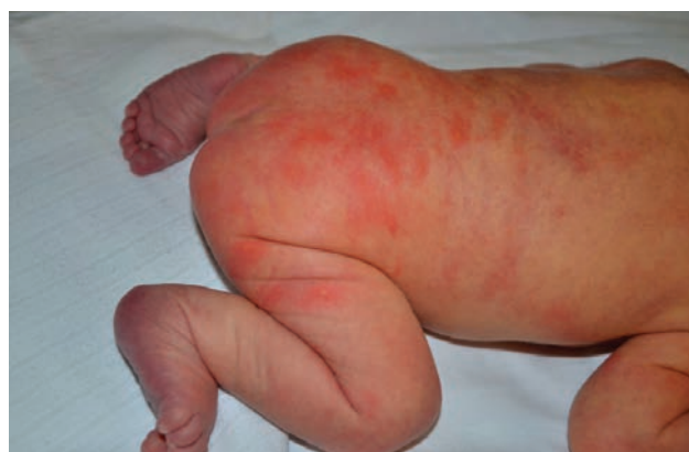
4. ábra Kiterjedt erythema toxicum neonatorum

Az átmeneti, benignus jelenségek közül a leggyakoribb, illetve talán a legismertebb az ETN (4. ábra). A jellegzetes, haragos-vörös udvarral körülvett, néhány milliméteres papulák és pustulák általában lokalizáltan fordulnak elő, ritkábban azonban a testfelszín szinte teljes egészét is érinthetik. A TNPM-t egyes szerzők az ETN variánsának tekintik, néhány különbséget azonban fontos megjegyezni. A TNPM előfordulási gyakorisága magasabb a sötétebb bőrű újszülöttek körében. Az ETN esetén a születést követően 24-48 óra múlva észlelhetjük leggyakrabban a tüneteket, lefolyásuk pedig néhány napon át hullámzó jelleget mutat. A TNPM jellegzetesen három fázisban nyilvánul meg. Első lépésként néhány mm-es szuperficiális, intra- vagy subcornealis vesiculák, vesiculopustulák alakulnak ki, főként az arc, nyak, hát és a lábszárak területén. A második fázisban a pustulák helyén finom elemű, gallérszerű hámlás, majd ezt követően hyperpigmentált maculák jelennek meg. Mind az ETN, mind a TNPM esetén fontos a szülők megnyugtatója a jelenség benignus kimenetelét illetően.