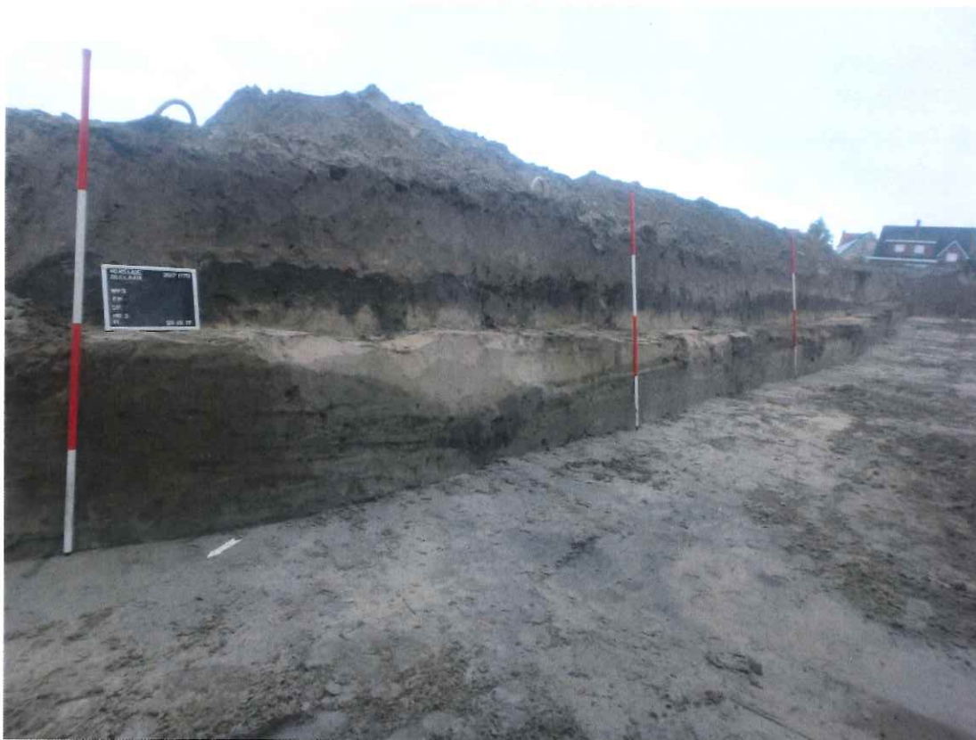
Fig. 3: Noordelijke profielregistratie, met de opeenvolging van verschillende nederzettingshorizonten en duinafzettingen

de watervoerende gebruiksfase) dateert uit de tweede helft van de 15de en de eerste helft van de 16e eeuw. Het is niet duidelijk wanneer de structuren aangelegd werden. In de tweede helft 17de- en 18de eeuw werden de sporen min of meer bedekt door duinzand. Dit wordt bevestigd door historische kaarten zoals die van het kadaster: daarop wordt geen enkele landschappelijke indeling meer weergegeven, wat impliceert dat deze volledig in onbruik raakte. wat aangeeft dat ze behoren tot een fossiel landschap, bedekt door duinzand.