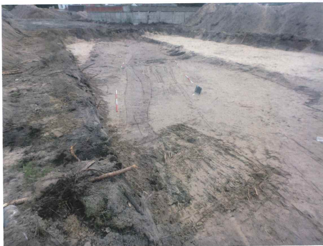
Fig. 2: Het grachtensysteem (links) met wegtracé in het vlak (WP01, vlak 02)

Een tweede sporencluster (enkele kuilen en paalkuilen) bevond zich aan westelijke zijde van het onderzoeksterrein. Het is (voorlopig) moeilijk de sporen ruimtelijk en functioneel te interpreteren. Zo behoren de twee paalkuilen alvast niet tot de paalzetting van een structuur en lijken de kuilen (vnl. gevuld met gebruiksaardewerk; geen bouwpuin) eerder willekeurig ingeplant. Meer duidelijkheid hierover ligt wellicht buiten de opgravingsput in westelijke richting. De stratigrafie wijst hier op een relatief eenvoudige, rurale bewoningshorizont, die bestond uit een organische, relatief dunne leeflaag. Dat contrasteert sterk met de complexere stratigrafie van meerdere leeflagen en ophogingen in de noordoostelijke hoek van het onderzoeksterrein.