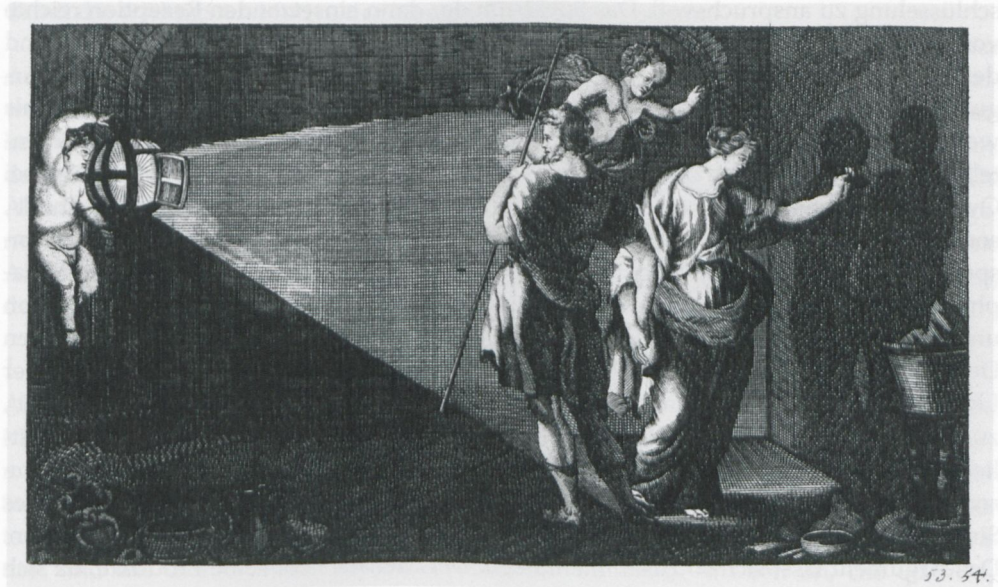
Abb. 3: [Joachim Sandrart]: Die Erfindung der Zeichen- und Malkunst durch die Tochter des Dibutades , in: G[ottlieb] H[ermann], Neu-vollständiges Reiß-Buch... Nürnberg 1707.

gungstradition – auf i-dolor zurückführen, auf die Hoffnung, dass durch das Bildwerk der ‚Schmerz‘ über den Verlust einer geliebten Person ‚weggehen‘ möge. 9