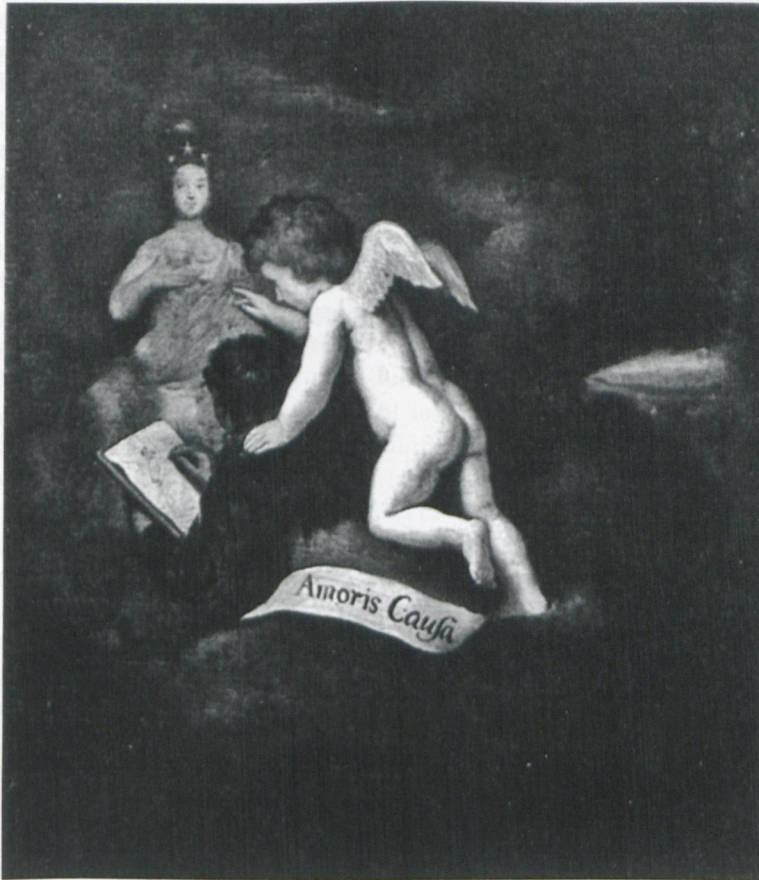
Abb. 2: Samuel van Hoogstraten: Guckkasten – Detail „ Amoris causa “, in: Thijs Weststeijn, The Visible World. Samuel van Hoogstraten's Art Theory and the Legitimation of Painting in the Dutch Golden Age . Amsterdam 2008, Fig. 36, S. 94.

trachter vor dieser Schmalseite schließlich entzerrt sich auch die Anamorphose auf dem Deckel des Kastens zu einer nackten Venus/Erato im Bett mit Cupido – und stellt quasi den Lohn für die Liebesmühen in Aussicht.