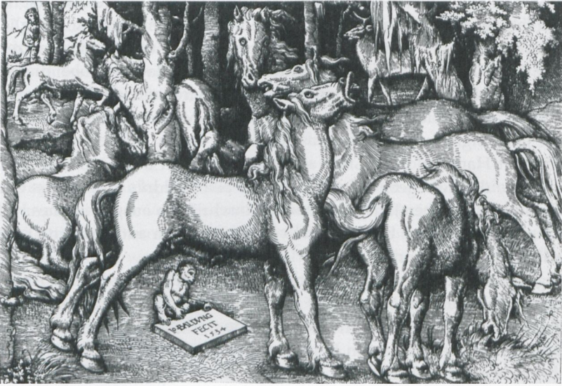
Abb. 17: Hans Baldung Grien: Brünstiger Hengst in einer Gruppe von Wildpferden (1534), Holzschnitt (22,5 x 33,2 cm), Nürnberg, Germanisches Nationalmuseum, Kupferstichkabinett, in: Joseph Leo Koerner, The Moment of Self-Portraiture in German Renaissance Art . Chicago u.a. 1993, Abb. 203, S. 428ff.