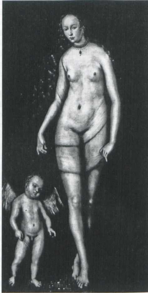
Abb. 8: Lucas Cranach der Ältere: Venus und Amor (1515–18),

der', wie sie laut Plinius der Schaum des geworfenen Malerschwamms des Protogenes erzeugte und die hier kaum Sinn ergeben würden). Vielmehr wird auf die kreative Potenz des Malers angespielt, die Farben auf der Leinwand zu einer neuen, vollkommenen Gestalt zu formen.