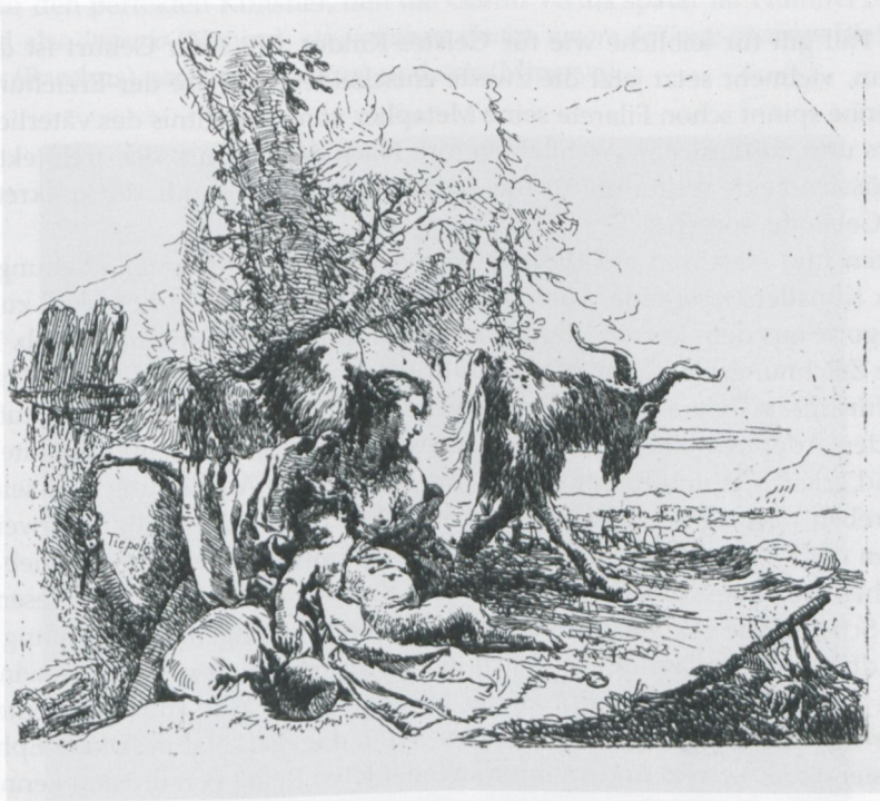
Abb. 11: Giambattista Tiepolo: Nymphe mit kleinem Satyr (aus der Serie der Capricci ), (1735–43), Radierung (14,1 x 17,5 cm), Padua, Museo d'Arte Medievale e Moderna (Inv. R.I.G. 4564), in: Cristina Donazzolo Cristante, Vania Gransinigh (Hgg.), Giambattista Tiepolo tra scherzo e capriccio . Disegni e incisioni di spiritoso e saporitissimo gusto. Mailand 2010, Kat. 7, S. 51.

Dagegen halten die Sorgen um eine kinderreiche Familie den Maler von der wirklichen Inspiration und Kunst ab, indem er gezwungen ist, nur um des Gelderwerbs willen zu arbeiten. Marcus Gheeraerts d.Ä. schildert 1577 auf einem erstaunlich großen Zeichenblatt (möglicherweise in Vorbereitung eines Stiches) eine entsprechende, witzig-allegorisch zugespitzte Situation. Darunter ist, möglicherweise nicht vom Maler selbst, ein Juvenal-Zitat notiert (Sat. 3, 164f.): „Haud facile emergunt quorum virtutibus obstat res angusta domi.“ Ähnlich skizziert Adam Elsheimer die Verzweiflung des Künstlers ob seiner finanziellen Nöte, die den Flug des Ingeniums immer wieder auf den Boden der Tatsachen zurück ziehen. 88