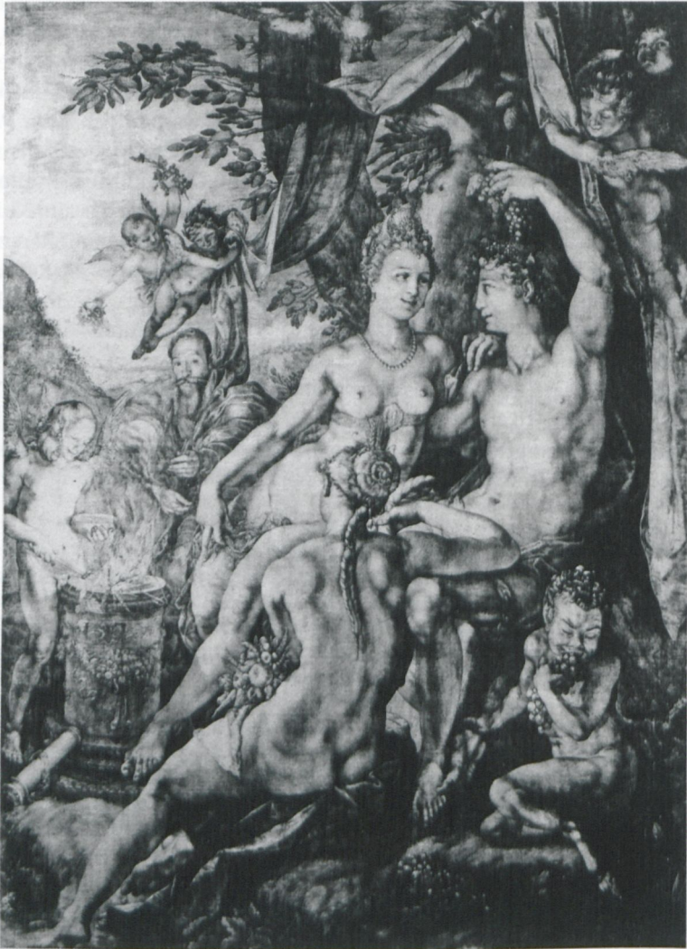
Abb. 4: Hendrick Goltzius: Sine Baccho et Cerere Friget Venus (1606?), Braune Federzeichnung auf weiß graduiertem Leinwand (219 x 163 cm), St. Petersburg, Eremitage, in: Madeleine Viljoen, To Print or not to Print? Hendrick Goltzius' 1595 „Sine Baccho et Cerere Friget Venus“ and Engraving with Precious Metals , in: Zeitschrift für Kunstgeschichte 74 (2011/1), S. 45–76, hier: Abb. 21, S. 72.

diligenza, Con studio, and Con Amore; The first, is but a bare and ordinary diligence, The second, is a learned diligence; The third, is much more, euen a louing diligence; They meane not with loue to the Bespeaker of the Worke, but with a loue and delight in the Worke it selfe, vpon some speciall Fancie to this, or that Storie; [...]. 23