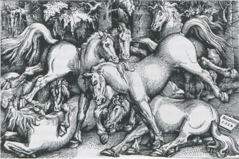
Abb. 19: Hans Baldung Grien: Pferdekampf (1534),

Holzchnitt (23 x 34,4 cm), Nürnberg, Germanisches Nationalmuseum, Kupferstichkabinett, in: Joseph Leo Koerner, The Moment of Self-Portraiture in German Renaissance Art . Chicago u.a. 1993, Abb. 207, S. 428ff.