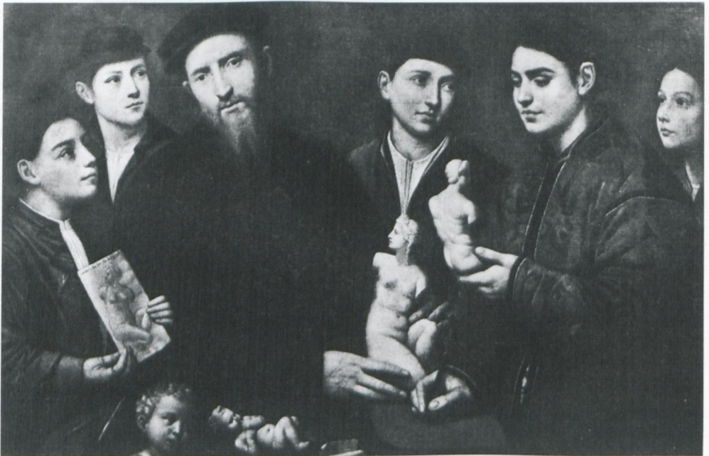
Abb. 13: Bernardino Licinio: Selbstbildnis des Bernardino Licinio mit seinen Schülern (um 1535–40), Öl auf Leinwand (82 x 127 cm), Alnwick Castle, Sammlung des Duke of Northumberland, in: Gian Alberto Dell'Acqua (Hg.), I pittori bergamaschi: dal XIII al XIX secolo . Band 3.1. Bergamo 1975, Abb. 4, S. 455.

Keine Allegorie, sondern zunächst wohl das früheste Beispiel eines Gruppenporträts mit dem Künstler-Vater im Kreis der Kinder und Schüler bietet ein für diesen Zeitpunkt erstaunlich großformatiges, längsrechteckiges Gemälde (Öl auf Leinwand, 127 auf 82 cm) des vor allem in Venedig tätigen Malers Bernardino Licinio (Abb. 13). Da das heute in Alnwick Castle in der Sammlung des Duke of Northumberland verwahrte Bild alle bislang entwickelten Gedanken geradezu lehrbuchhaft zusammenfasst, andererseits kaum beachtet ist, scheint eine etwas ausführlichere Analyse gerechtfertigt. Stilistisch lässt es sich in die mittleren bis späteren 1530er Jahre datieren. 92 Wenn es nicht nur ganz allgemein als ‚Werkstattbild‘ bezeichnet wird, glaubt man darin ein Gruppenporträt des Bruders von Bernardino Licinio, des ebenfalls als Maler tätigen Arrigo Licinio, und dessen Familie identifizieren zu dürfen.