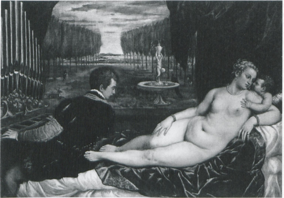
Abb. 6: Tiziano Vecellio: Venus und Orgelspieler = Venere con organista e Cupido (1545–1548), Öl auf Leinwand (148 x 217 cm), Madrid, Museo Nacional del Prado; © Museo Nacional del Prado.

Ein weiterer Beweis für die Wirkmacht dieser Bildwerke und -theorien ist, dass bereits im 15. Jahrhundert auch der Übergang zur nächsten Stufe des Begehrens auf der linea amoris thematisiert wurde: das Berühren. Lorenzo Ghiberti etwa empfiehlt, die antike Statue ausgerechnet eines Hermaphroditen abzutasten, um die Qualität der Marmorbearbeitung zu erkennen. 32 1536 vermerkt der deutsche Romreisende Johann Fichard süffisant, dass Seine Heiligkeit, wenn sie im Castel S. Angelo in der Badewanne sitze, die nackten Mädchen der Wandbemalung wohl andächtig betaste. 33 Wiederum positiv gewendet wird die Vorstellung im gleichen Jahr auf einem Stich des Agostino Veneziano, der die römische Akademie des Baccio Bandinelli zeigt (bezeichnet: „ACADEMIA DI BACHIO BRANDIN“) – eine Versammlung von Gelehrten, Literaten, Kunstkennern