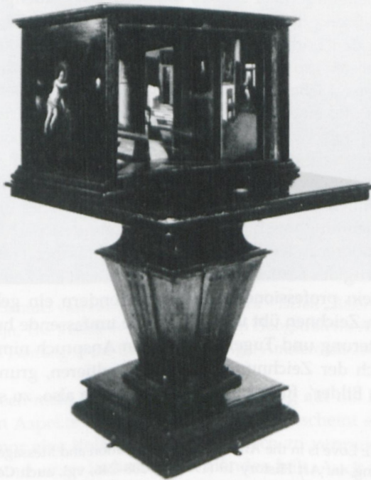
Abb. 1: Samuel van Hoogstraten: Guckkasten (ca. 1656–62), Holz (58 x 88 x 63,5 cm), London, National Gallery, INV. 3832, in: Thijs Weststeijn, The Visible World. Samuel van Hoogstraten's Art Theory and the Legitimation of Painting in the Dutch Golden Age . Amsterdam 2008, Fig. 33, S. 92.