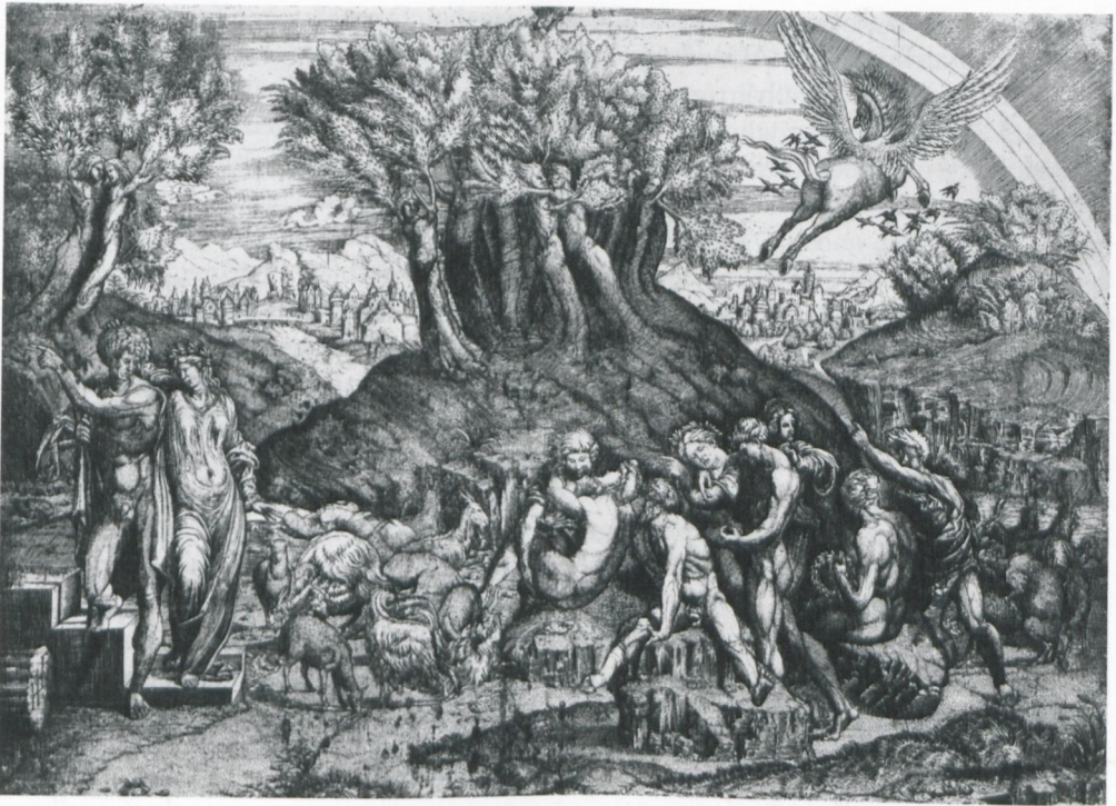
Abb. 16: Monogrammist HFE: Parnass-Parodie (um 1530), Kupferstich (36 x 50,6 cm), Sammlung Baselitz, in: Ger Luijten (Hg.), La bella maniera . Druckgraphik des Manierismus aus der Sammlung Georg Baselitz. Bern u.a. 1994, Kat. 6, S. 46f.

Der Anlass für diesen Aufruhr auf dem Parnass scheint im Bild selbst aufgerufen: die Paare in ihren unterschiedlichen Stellungen erinnern an den größten Skandal des Jahres 1524 – die Publikation von 16 Stichen Marcantonio Raimondis nach Zeichnungen Giulio Romanos, bekannt geworden unter dem Namen I Modi . 103 Hier wurde erstmals die unverhüllte Präsentation sexueller Geschlechtsakt-Akrobatik von Personen, die nicht genauer bestimmt und durchaus als Zeitgenossen wahrgenommen werden konnten, verbunden mit dem weitgehend freien, unkontrollierten Zirkulieren im Medium der Druckgraphik. Das Ereignis wurde symptomatisch für eine allgemeine Tendenz in Italien wahrgenommen: den vollkommenen Verfall der Tugenden selbst in den hehren Künsten. Keine zwei Jahrzehnte nach Raffael war der Parnass wieder profaniert und in höchstem Aufruhr, die Musen verführt und ihrerseits nur mehr Verführerinnen zu niederen Lüsten.