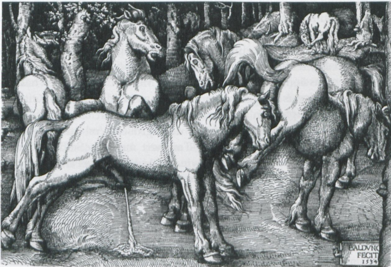
Abb. 18 Hans Baldung Grien: Abschlagende Stute (1534), Holzschnitt (22,8 x 33,9 cm), Nürnberg, Germanisches Nationalmuseum, Kupferstichkabinett, in: Joseph Leo Koerner, The Moment of Self-Portraiture in German Renaissance Art . Chicago u.a. 1993, Abb. 206, S. 428ff.