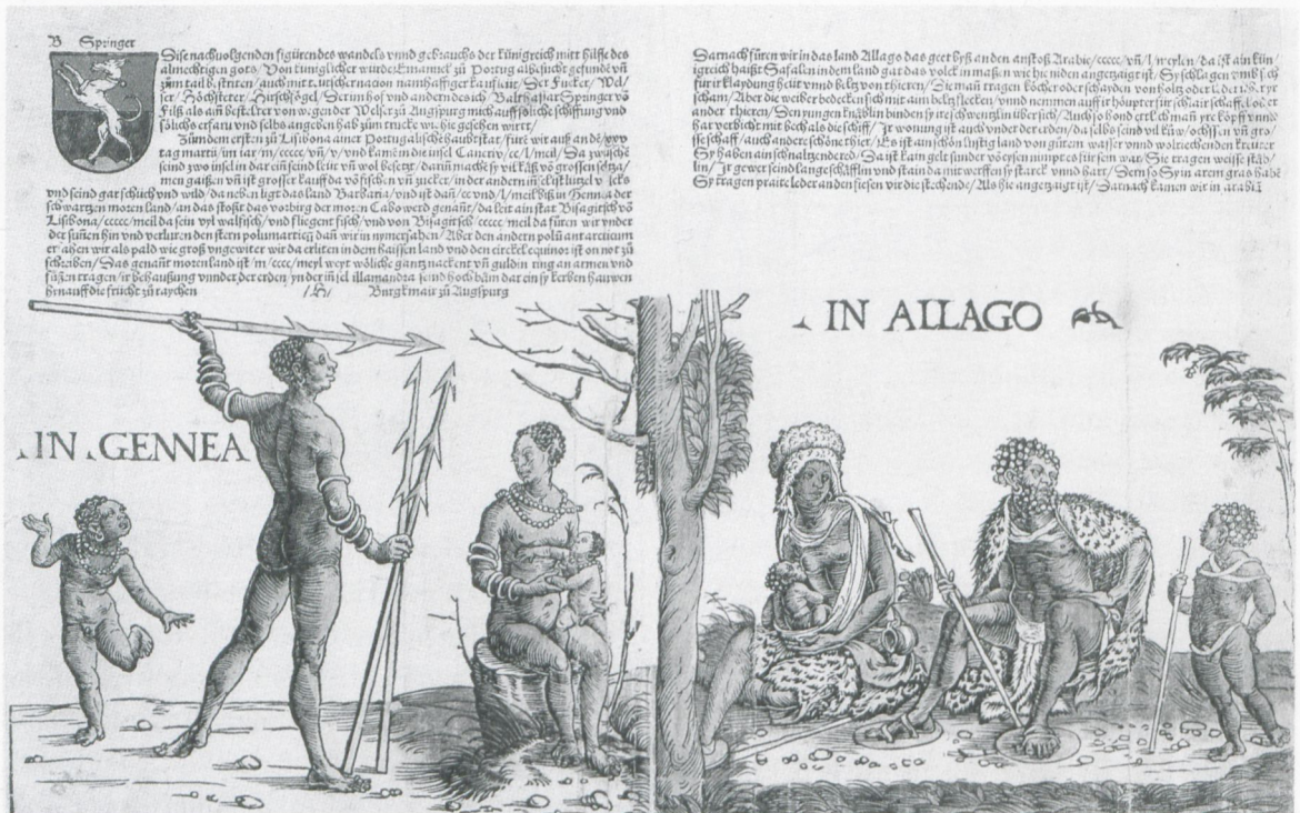
Abb. 3 Hans BURGKMAIR: Afrikanische Völker von Guinea und Algoa, 1508; kolorierter Holzschnitt (Neuhof, Freiherrlich von Welsersche Familienstiftung)

fremden Göttern, Religionen, Riten, Kultorten und -gegenständen zukam. Die Bilder erlaubten und provozierten unmittelbare (ihre Begleittexte teils ausser Acht lassende, teils im Ergebnis überflügelnde) Vergleiche – ähnlich etwa wie auch die frühneuzeitlichen Zusammenstellungen der unterschiedlichen Trachten und Kleidermoden der Welt deren Verschiedenartigkeit und zuweilen schnellen Wechsel besonders deutlich vor Augen führten (man vergleiche etwa mit Blick auf Picarts Titel bereits das auf Cesare Vecellios Habiti antichi, et moderni di tutto il mondo basierende Werk von Jean de Glen: Des habits, moeurs, cérémonies et façons de faire anciennes et modernes du monde , Lüttich 1601). Verweisen ließe sich auch auf den Fall des erstaunlich frühen und präzisen ‚ethnographischen Blicks‘ und Darstellungsmodus, mit dem Hans Burgkmair 1508 einen Zug afrikanischer und indischer Völkerschaften im Holzschnitt festhielt (als ‚Bebilderung‘ zum Bericht des Balthasar Springer über seine Indienreise 1505–1506 in Form eines Frieses aus einzelnen Blättern gedruckt; Abb. 3). 3 Dass dann eine ganze Reihe wenig späterer Bilder zu Göttern, Religionen und Riten die (kollektiven) Vorstellungen in Europa über Jahrhun-