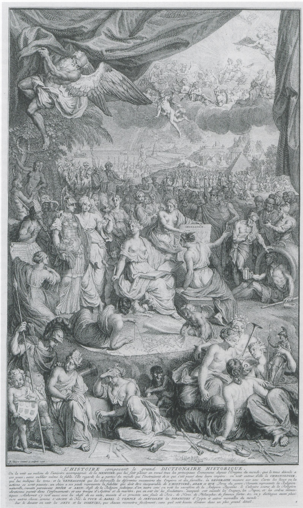
Abb. 4 Bernard PICART: „Die Geschichte verfaßt das große Dictionnaire Historique“ (frz. Fassung des Frontispizes zu Abraham G. Luiscius: Het algemeen historisch, geographisch en genealogisch woordenboek, s'Gravenhage/Delft 1724–1737, Bd. 1)