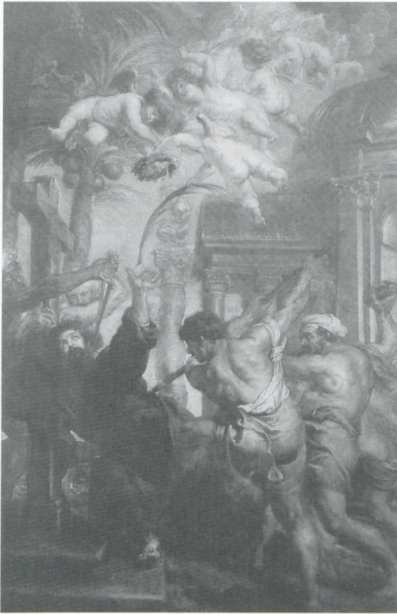
Abb. 8 Peter Paul Rubens' „Martyrium des hl. Thomas in Indien“; um 1636–38, Öl auf Leinwand (Prag, Národní galerie)