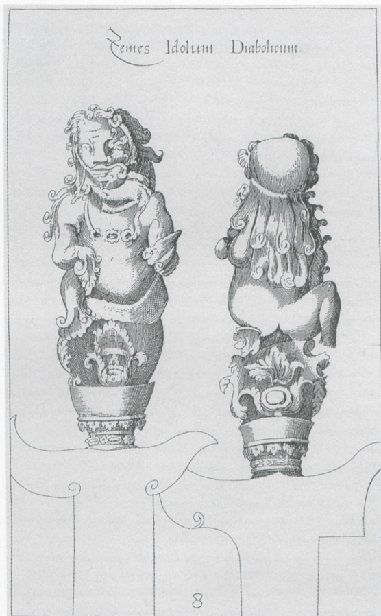
Abb. 7 „Zemes Idolum Diabolicum“ (Caspar PLAUTIUS: Nova typis transacta navigatio novi orbis Indiae occidentalis , 1621, Taf. 8)

andere europäische Skulptur – sei es der Antike, sei es der Renaissance – bis 1626 in einer systematischen Serie von vier Ansichten druckgraphisch festgehalten worden war, belegt nicht nur das Interesse an diesem Exoticum und das Unvermögen auf Seiten der europäischen Betrachter angesichts dieses neuartigen Bildwerks, sich anhand nur einer oder zweier Abbildungen die anderen Ansichten des Objekts vorzustellen. 15 Hier manifestiert sich auch ein neues antiquarisches Bemühen um möglichst authentische und umfassende Dokumentation und Reproduktion im Bild, die nicht nur von Pignoria, sondern zunächst vor allem auch vom Besitzer des Idols, Peiresc, vorangetrieben wurde. 16 Peiresc ließ alle Stücke seiner Sammlung in Zeichnungen von Poussin, Rubens und anderen so exakt wie möglich festhalten, so auch das Idol in vier Ansichten (Abb. 6). Den Gelehrtenfreund Pignoria bat er am 4. Januar 1616