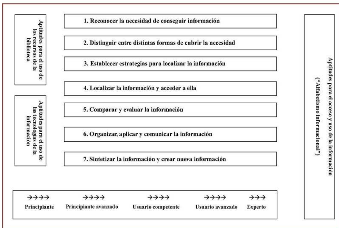
Figura 1 Modelo de los 7 Pilares de SCOLUL