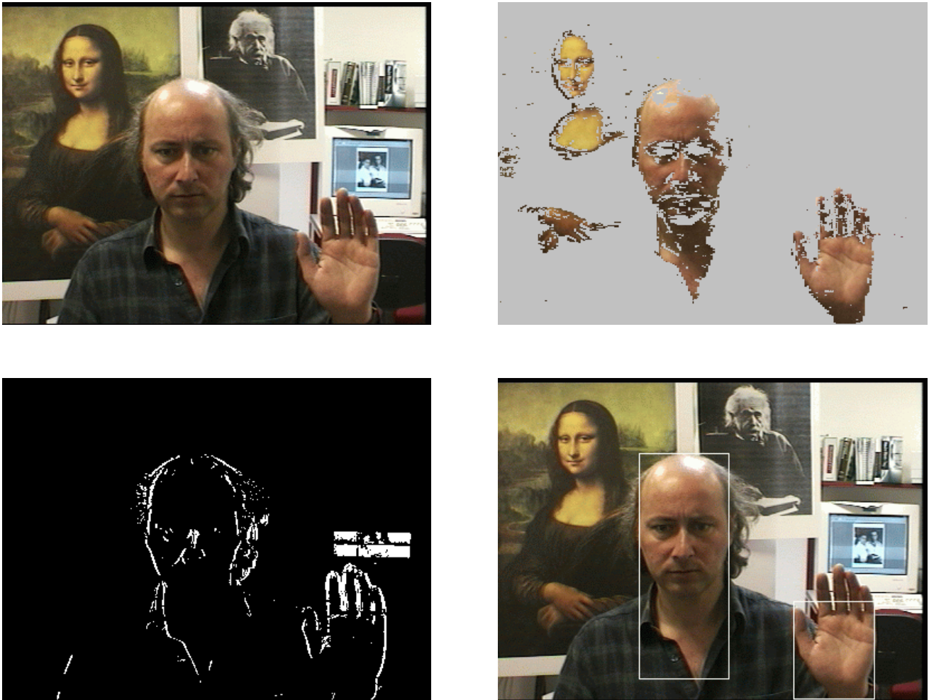
FIG. 1 — [a] : Image d'origine issue d'une séquence. [b] : Détection de la teinte de la peau : visage et main de la personne et de la Joconde. [c] : Détection du mouvement entre deux images : la personne et l'écran (non synchronisé) sont détectés. [d] : Détection des zones d'intérêts : parties connexes de teinte de la peau en mouvement : la Joconde immobile n'est pas retenue.

La détection de mouvement (figure 1.c) permet d'éliminer les parties du décor de teinte de la peau ainsi que des illustrations fixes de visages (tableaux, affiches). Un seuil prend en compte le bruit des capteurs CCD. La détection de mouvement ne se fait que lorsque la caméra est immobile, sans changement de focale et de mise au point. Des variations brutales de l'éclairage limitent la portée de ce type de traitement.