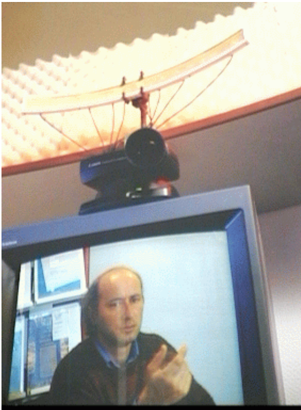
FIG. 4 — Le visiophone “personne libre” LISTEN pilote l’antenne acoustique à partir des informations visuelles fournies par la caméra motorisée.