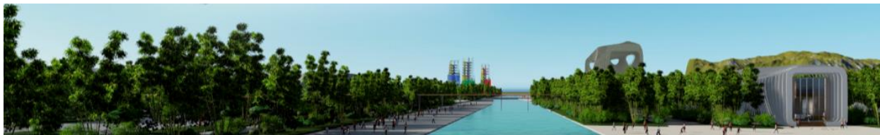
Figura 1. Render parque Lineal La Igualdad.

De tal forma, esta porción de territorio deja de ser el final o el límite de una ciudad, y pasa a ser una franja intermedia, la cual cada día se hace más grande, llena de múltiples escenarios; ríos, lagos, bosques, pies de monte, sistemas agrícolas, viviendas, industrias, comercio y carreteras. Este fenómeno se ha hecho evidente en los últimos años, particularmente en la segunda mitad del siglo XX “Desde el año 2007 el mundo presenta una realidad nueva, hay más personas viviendo en ciudades que en el medio rural” 2 . A raíz de esto, elementos necesarios para garantizar la calidad de vida de los habitantes han sido trasladados o se encuentran a grandes distancias de los lugares de residencia. Estas franjas son nuevos escenarios con múltiples mixturas obtenidas de la realidad urbana y el campo. Históricamente las regiones de la periferia participan en la ciudad como abastecedor de las ciudades, no obstante, esta realidad ha cambiado, y las periferias se han vuelto un escenario de dispersión residencial que carece de toda intención ordenadora previa. En consecuencia, la solución pertinente no sería cambiar el uso del suelo, sino realizar proyectos enfocados en mejorar la calidad de vida a sus habitantes, calidad de vida que puede ser potencializada por medio de la creación de espacios públicos, zonas de permanencia, recreación y por sobre todo conexión de distintas realidades paisajísticas y urbanas bajo el modelo de corredores urbanos y parques lineales.