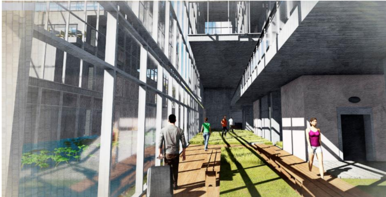
Figura 9. Render jardines internos, Espacios para el confort.

En consecuencia, se proyectan los espacios necesarios tanto para el atleta que resida en Bogotá como para el que viene de otras ciudades, promoviendo un ambiente de descanso posterior a su preparación. A la vez se proyectan espacios donde especialistas puedan tener control nutricional que deriva en mejorar la condición del atleta, ayudando en su desarrollo físico. Y por último se contemplan lugares para la asistencia médica, psicológica, fisioterapéutica, nutritiva, kinesiológica, optométrica y podológica para el atleta que lo necesite.