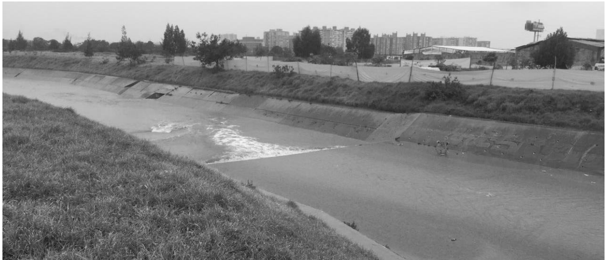
Figura 6. Fotografía, El Rio Fucha espacio vago e indefinido.

vial y fluvial serán el marco para construir y planificar el sitio como un espacio para la vida colectiva.