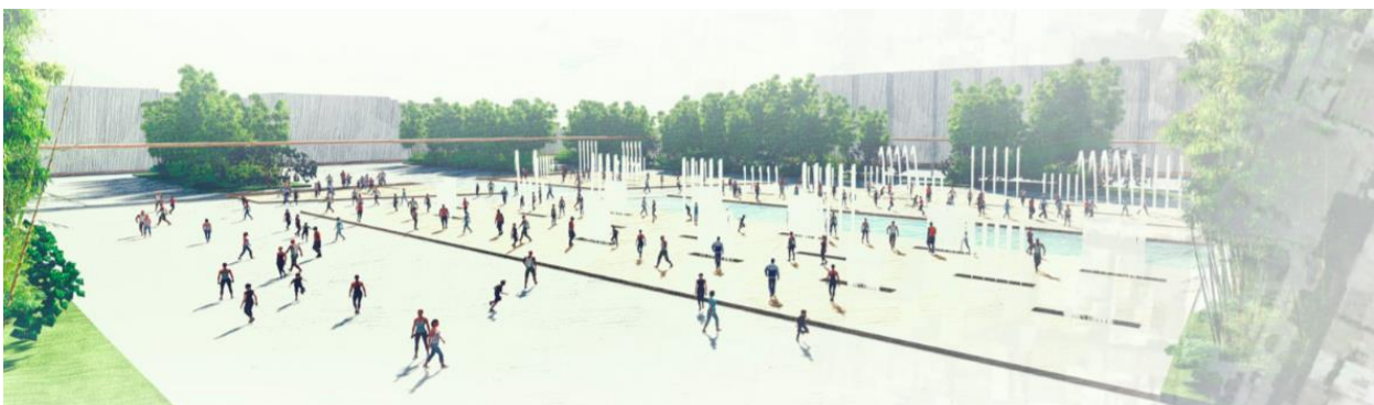
Figura 3. Render Plazoletas sensoriales-Resignificación del vacío.

El crecimiento de la ciudad y el constante movimiento en la trama de la ciudad, ha generado transformaciones que han dejado atrás espacios residuales, cada día es más importante que la arquitectura y el urbanismo logre mutar y absorber estas transformaciones, más que la creación de nuevos espacios, se requiere reutilizar y reorganizar territorios, revertir daños ecológicos y hacer partícipes factores, que alguna vez fueron rechazados o ignorados. Él lugar del vacío es flexible y capaz de acomodar por medio de capas, actividades planificadas e imaginadas, a través de la incorporación de sistemas naturales y arquitectónicos.