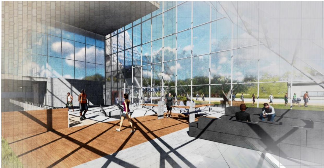
Figura 8. Render Lobby, Espacios flexibles.

Fuente: Alfonso- Rodríguez, 2017. CC BY-SA.