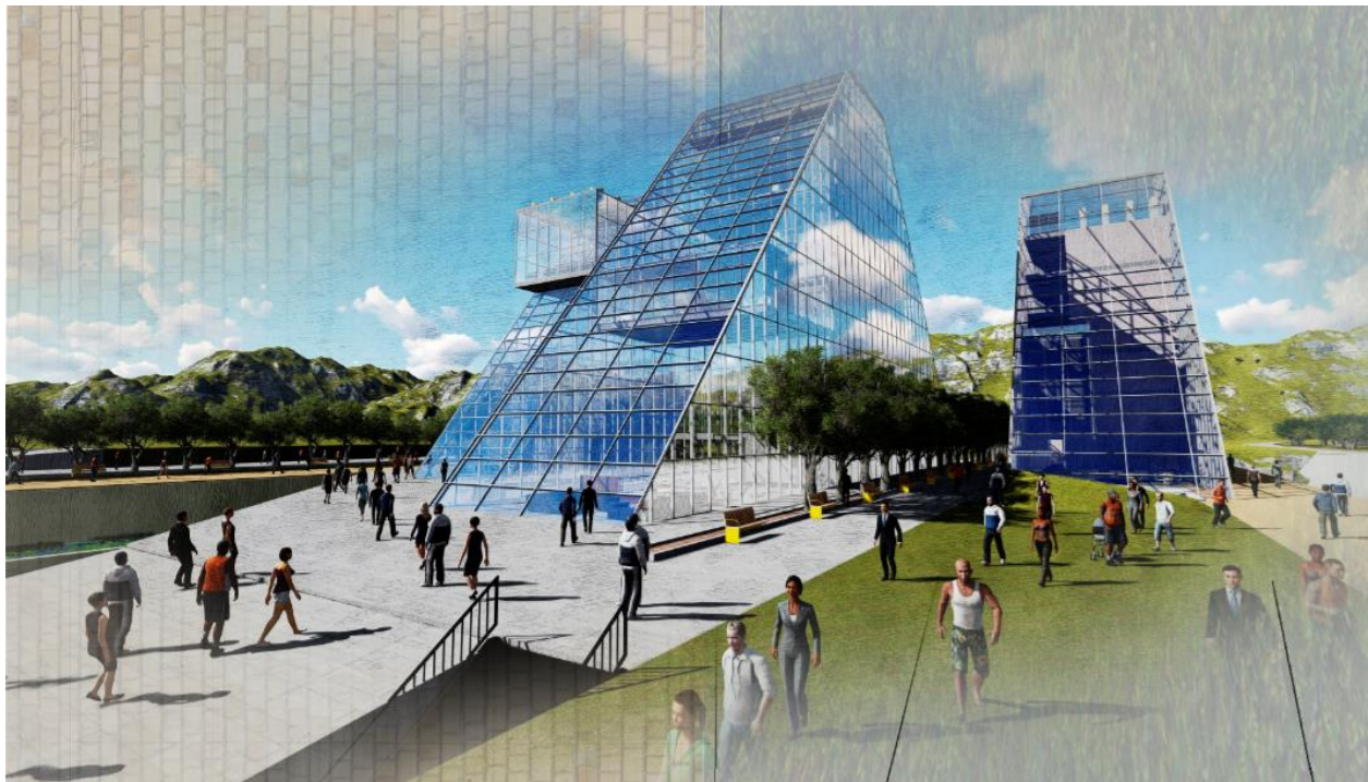
Figura 2. Render Centro de Atletismo y Patinaje Gravedad.

Lo no convencional puede brindarle significado al territorio y poder relacionar sistemas naturales y urbanos a través del espacio público, rescatando espacios neutros, que aparentemente puedan ser residuales y potencialmente ofrecen la oportunidad de ser recuperados por medio de un proyecto urbano.