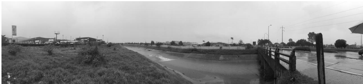
Figura 5. Fotografía, El vacío, espacio flexible y expectante.

Es de gran interés para este proyecto, el fenómeno del vacío, puesto que representa un punto fascinante de atención. En Bogotá abundan estos espacios, quietos, algunas veces vacíos y otros abandonados, en los que nada sucede, los cuales no son elegidos por la gente, pero siguen allí inactivos. Estos lugares inactivos, estáticos y detenidos en el tiempo son espacios expectantes, llenos de posibilidades y de promesas. Estos espacios vagos e indefinidos, que muchas veces pueden interpretarse como negativos para la ciudad son espacios llenos de significado atrapados dentro de una trama, olvidados, completamente ajenos a la actividad de la ciudad y vacíos de identidad. Pero estos espacios, extraños, vacíos, abandonados y expectantes deben mantenerse de algún modo en la trama urbana, ser preservados a la vez que se integran.