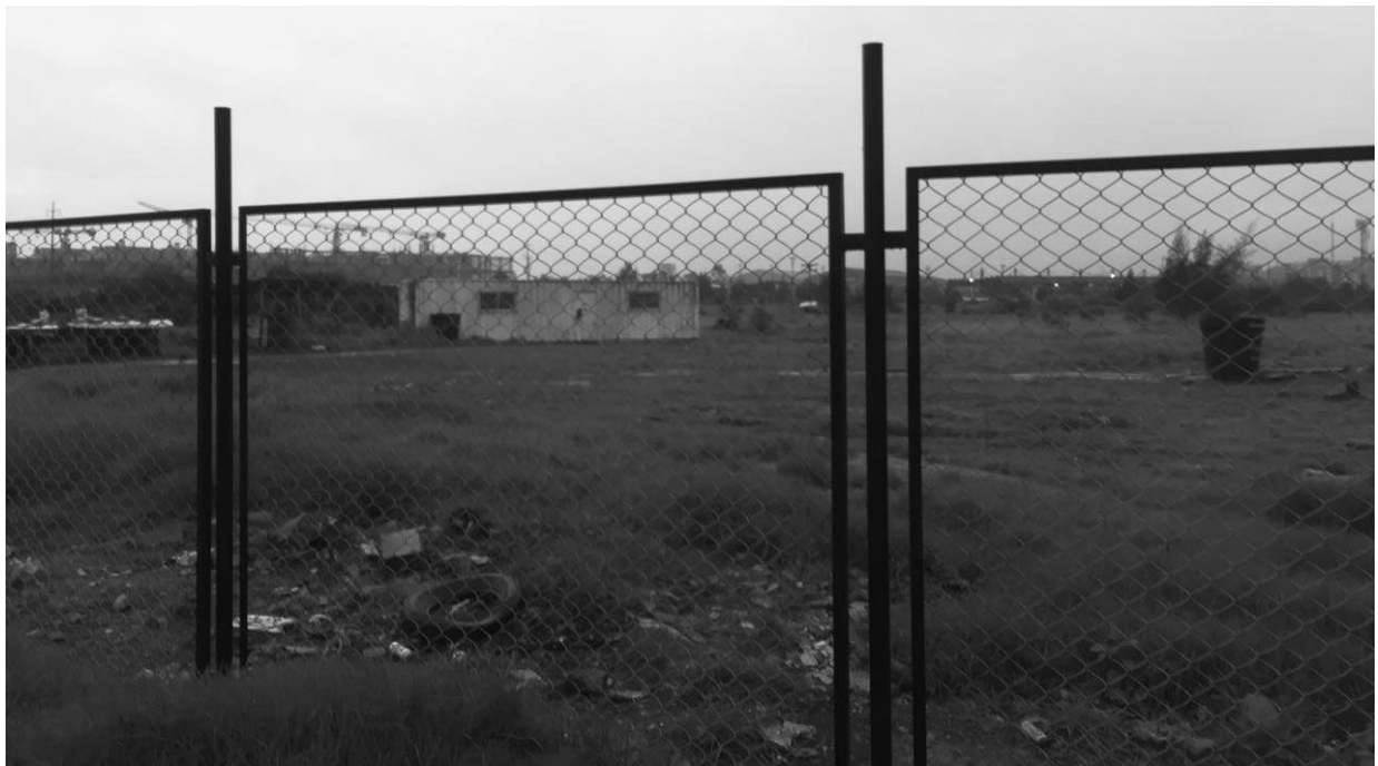
Figura 4. Fotografía, El vacío, atrapado en la trama.

A través de la fotografía es posible hacer un fiel estudio de campo, contextualizar el ambiente o entorno, y observar detalles y experiencias propias del lugar, a la vez que nos permite capturar como se mueve la gente, hacia donde va, y como interactúa, con las construcciones que allí se encuentran, de esta manera este proyecto es abordado desde la observación y el análisis de campo. La fotografía nos permite prestar atención en determinados puntos, acciones y problemas que nos dirigen a la construcción de un supuesto.