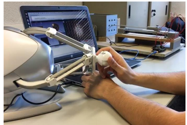
Figura 3. Novint Falcon, en primer plano, con el sistema robótico y el phantom en segundo plano.

Como dispositivo de realimentación háptica para la integración de todo el sistema se ha seleccionado un sistema comercial de bajo coste orientado al mundo de los videojuegos, Novint Falcon (Novint Technologies, Inc.) (Figura 3). Novint Falcon es compatible con Chai3D y su integración con éste no requiere ningún desarrollo añadido. Este dispositivo tiene tres grados de libertad por lo que se ha modificado el controlador de Chai3D asociado para que únicamente se transmitan los movimientos en el eje de inserción.